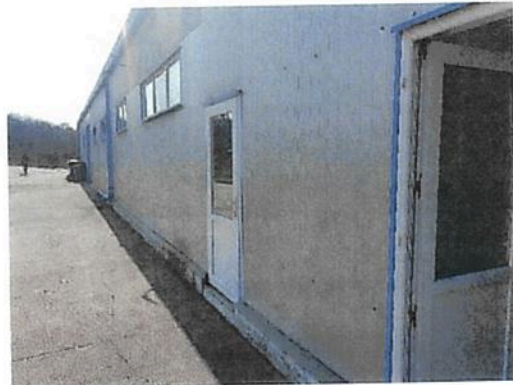
Vedere Fabrica C2