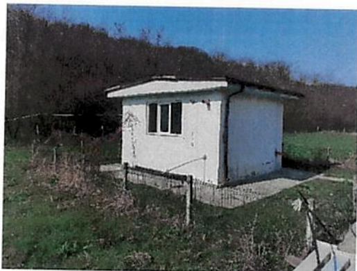
Vedere Cabina put forat C3