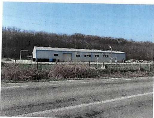
Vedere generala imobil