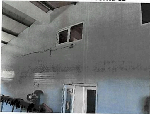
Vedere zona etaj birouri Fabrica C2