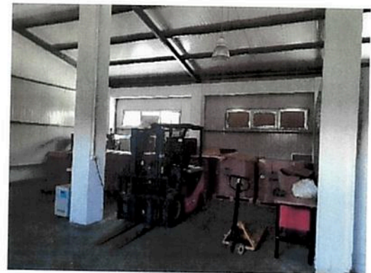
Interior zona Hala Fabrica C2