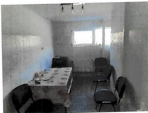
Interior zona birouri parter Fabrica C2