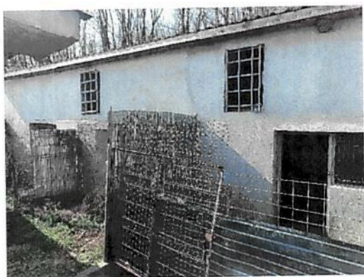
Vedere Anexa C4