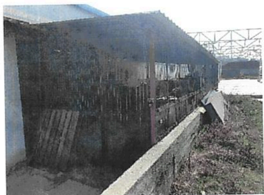
Zona spate Fabrica C2