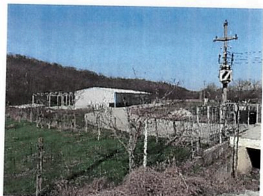
Vedere generala acces