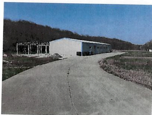
Vedere generala cai acces in curte