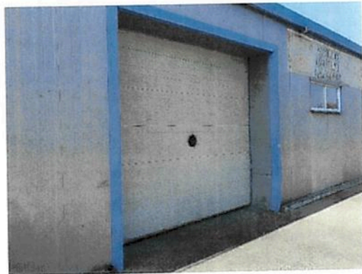
Vedere Fabrica C2