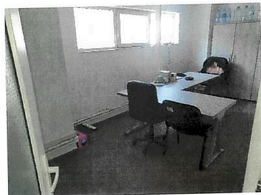
Interior zona birouri parter Fabrica C2