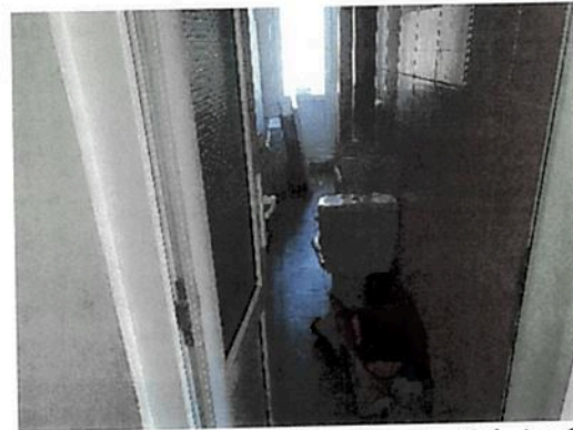
Interior zona birouri parter Fabrica C2