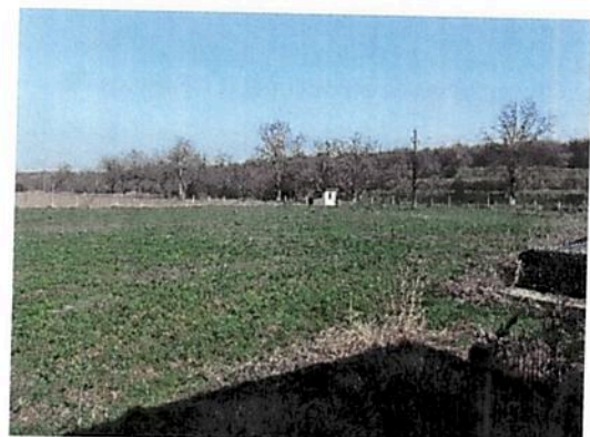
Vedere generala teren curte