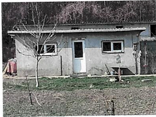
Vedere Anexa C1