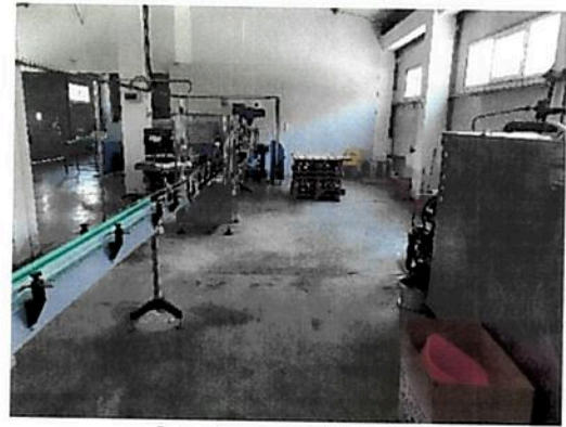
Interior zona Hala Fabrica C2