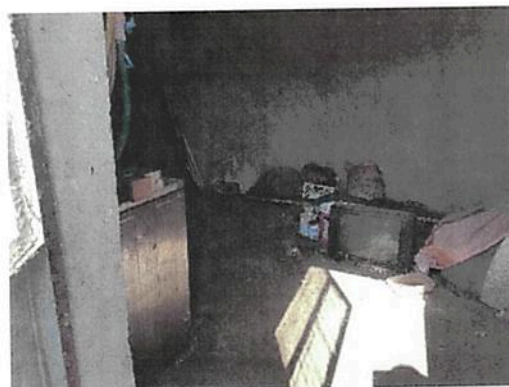
Vedere Anexa C4