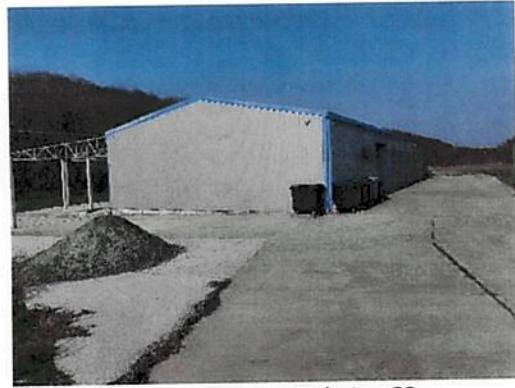
Vedere Fabrica C2