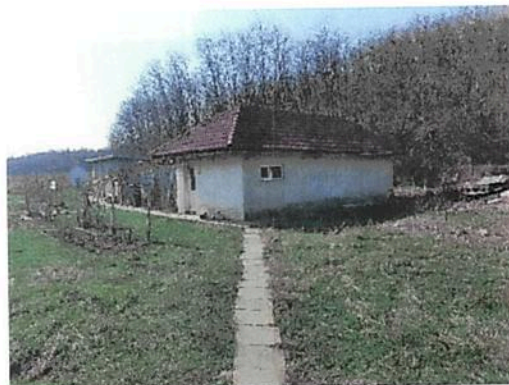
Vedere Anexa C4