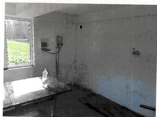
Interior Cabina put forat C3