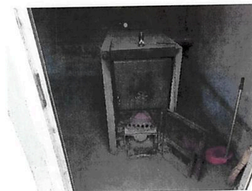
Centrala termica aferenta Fabrica c2