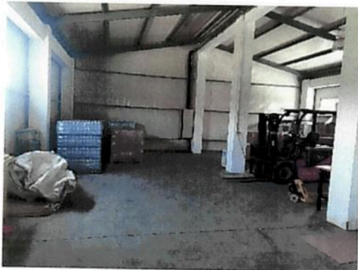
Interior zona Hala Fabrica C2