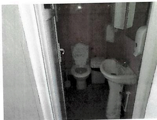
Interior zona birouri parter Fabrica C2