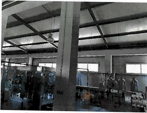
Interior zona Hala Fabrica C2