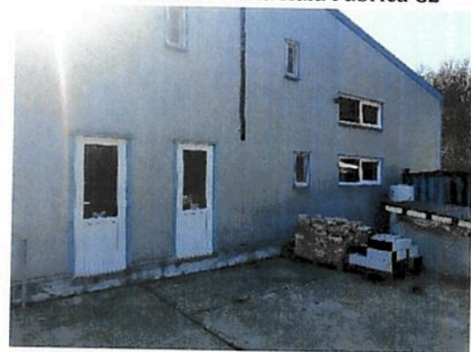
Vedere Fabrica C2