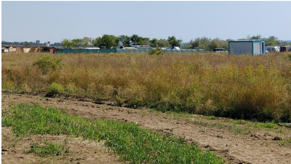
Foto 2 Zonă de campare în vecinătate

În apropierea amplasamentului analizat se mai găsesc câteva campinguri și terase pentru alimentație publică cu regim sezonier.