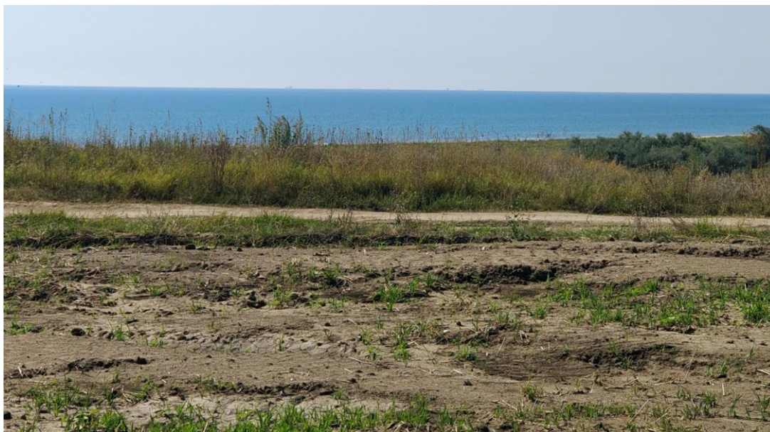
Foto 1 Situația actuală a amplasamentului

Amplasamentul vizat prin proiectul propus nu este indispensabil pentru speciile de interes comunitar, potențial cuibăritoare, având în vedere natura activităților desfășurate în zonă.