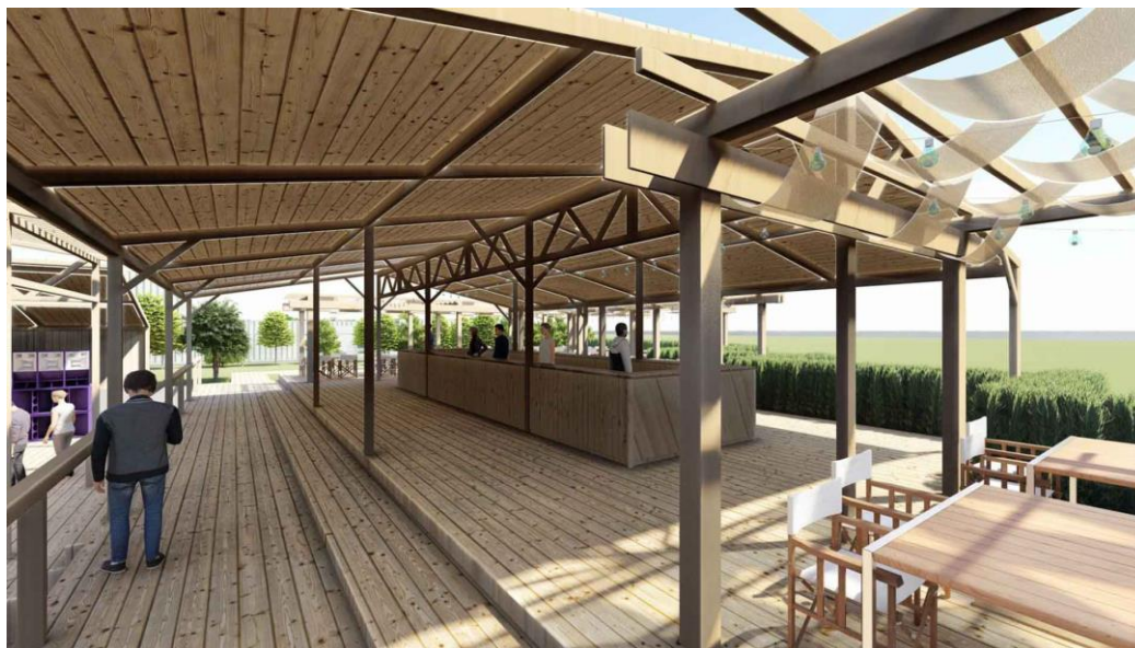
Figura 1 Simulare 3D zona de bar și servire a mesei

Suprafață rămasă liberă va fi amenajată cu gazon și vegetație de joasă înălțime și va fi utilizată pentru diverse evenimente în spațiu liber: ecran portabil pentru proiecții cinema, ring de dans, zonă pentru concerte, agrement etc. Pe această zonă pot fi distribuite șezlonguri gonflabile/ pliabile pentru turiștii cazați și va fi amenajat un loc de joacă pentru copii.