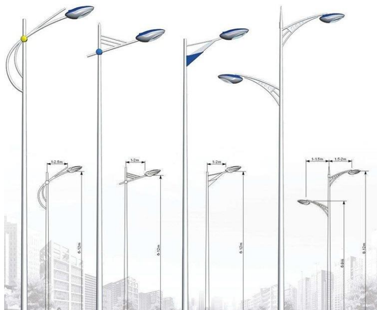
STÂLPI CU DUBLĂ CONSOLĂ CAROSABIL/TROTUAR ȘI PISTĂ