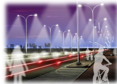
ILUMINAT INTELIGENT TRECERE DE PIETONI