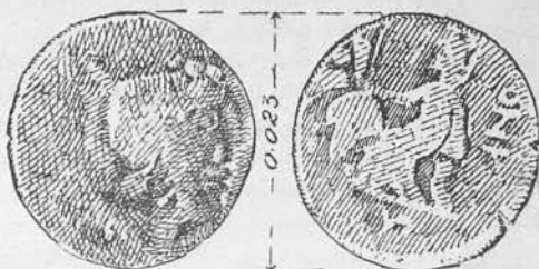
Fig. 1. — Moneda barbarizată (nr. 39).

38—40 Av. Dionysos cu privirea spre dr. De sub cununa de iederă, pletele cad pe umeri.