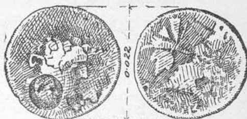
Fig. 2. — Surfrapare barbarizată (nr. 40).