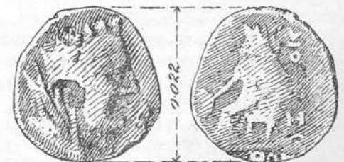
Fig. 4. — Varianta de la precedenta (nr. 42).