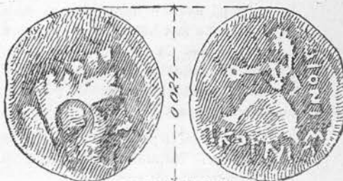
Fig. 3. — Detalii de pe moneda magistratului Acornion.