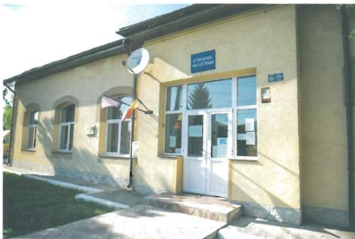
After School Valu lui Traian - realizat cu fonduri externe / Valu lui Traian After School - built using external funds