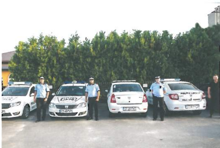
Baza auto Poliția Locală / Local Police Car Park