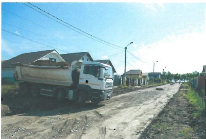
Lucrare la drumuri / Roadwork