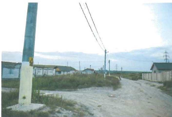
Introducere rețea de iluminat cartier Afumați / Setting of the lighting network in Afumati