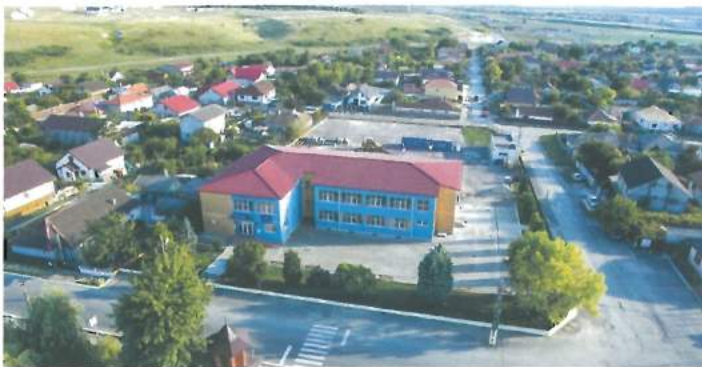
Școala Gimnazială nr. 2 - în curs de supraetajare (fonduri atrase) / School no. 2 – in process of superposing (attracted funds)