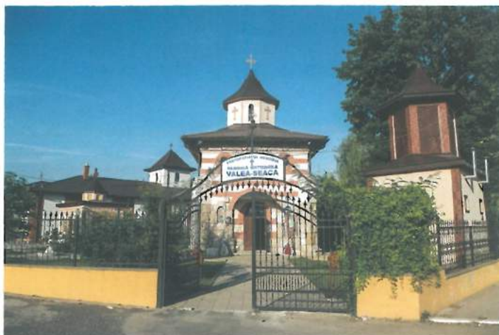
Biserica Sfinții Mihail și Gavril (buget local) / St. Michael and Gabriel Church (local budget)