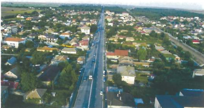
Privire de ansamblu Valu lui Traian / Valu lui Traian overview