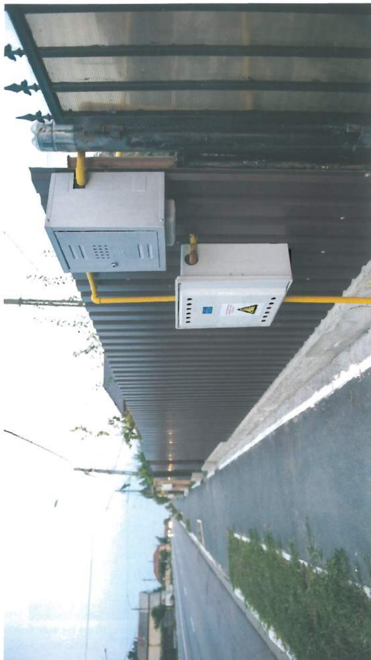
Sistemul de alimentare cu gaz —acoperă 80% din localitate / The gas supply system covers 80% of the locality