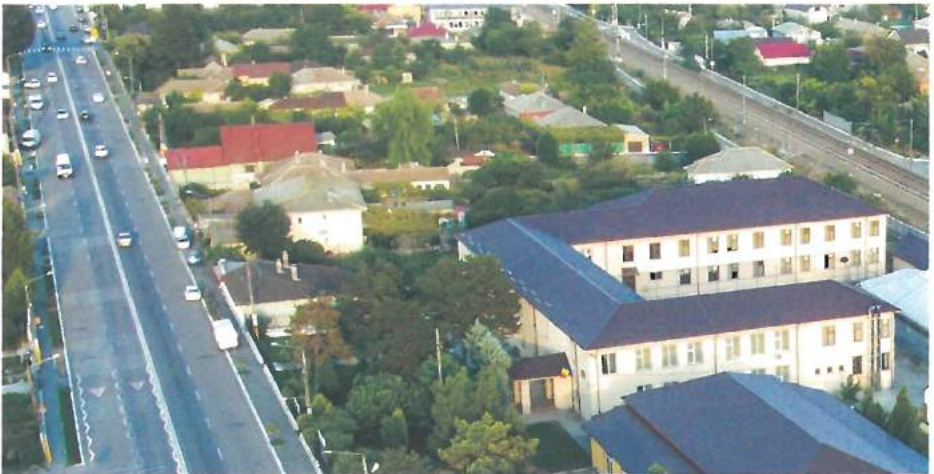
Extindere și reabilitare Școala Gimnazială nr 1. Extinderea a fost construită cu fonduri atrase și dotată din buget local /