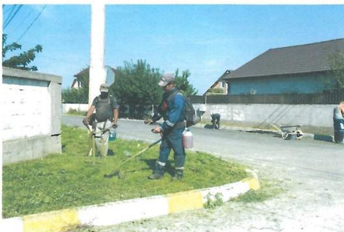
Cosire iarbă și îngrijire borduri prin SRL primărie / Grass mowing and ramp care taking by the Town Hall LLC