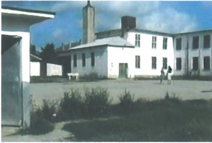
Așa arăta în 2004 înaintea perioadei de modernizare. Școala nr. 1 / This is how School no. 1 used to look like in 2004 before the modernization period