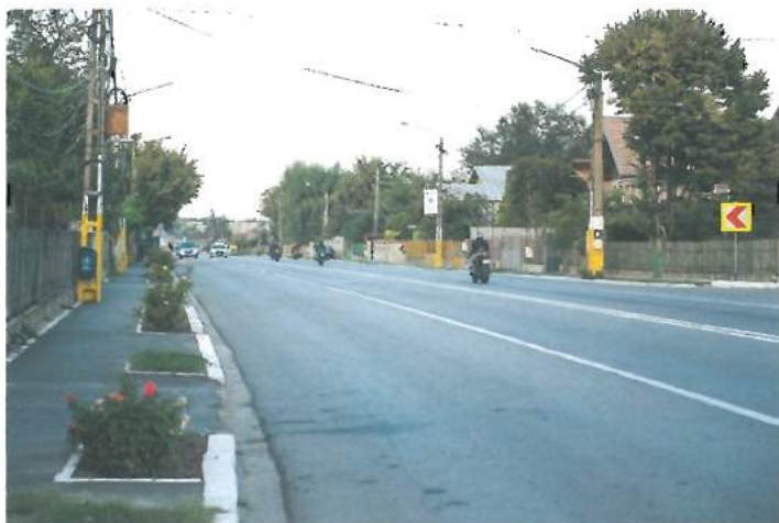
Trotuare și spații verzi Calea Dobrogei (buget local) / Calea Dobrogei sidewalks and green areas (local budget)