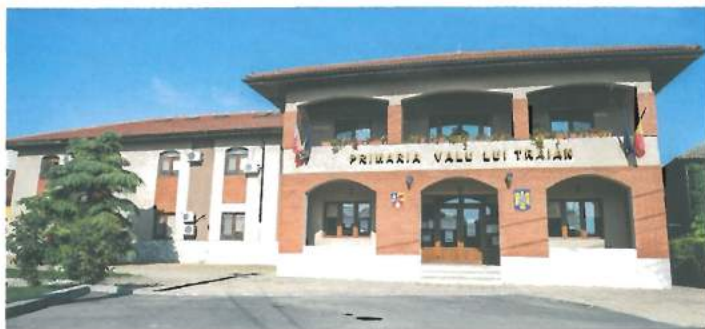
Primăria Valu lui Traian – construită din bugetul local / Valu lui Traian Town Hall - built from local budget resources