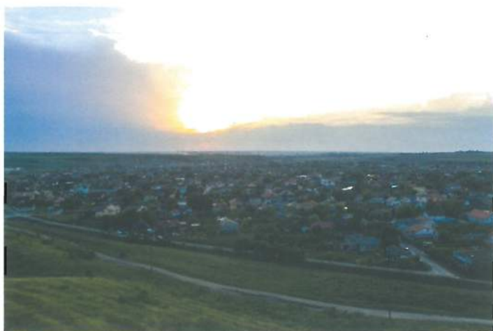
Apus în Valu lui Traian / Sunset in Valu lui Traian