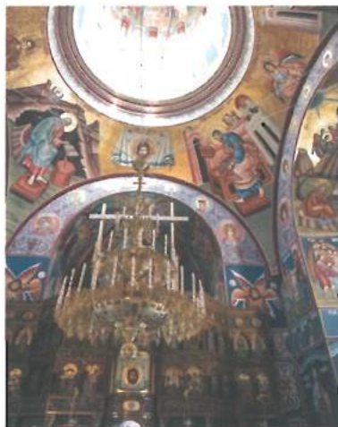
Biserica Sf. Parascheva (interior) / St. Parascheva Church (interior)