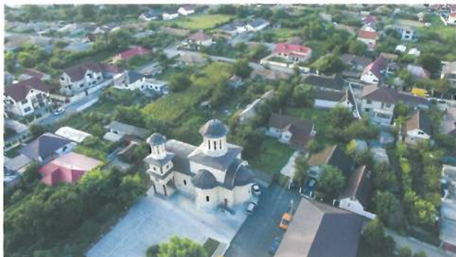
Biserica Sf. Parascheva - realizată din buget local / St. Parascheva Church – built using local budget resources