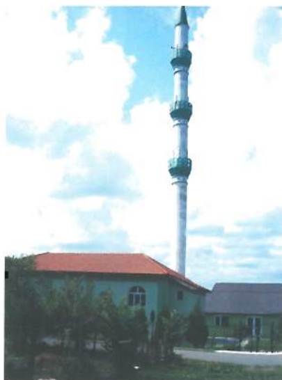
Geamia Valea Seacă / Valea Seaca Mosque