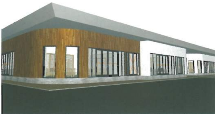
Planșa proiect viitoare grădiniță zona F / Blueprint of F area future kindergarten