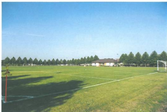
Baza sportivă / The Sports Center