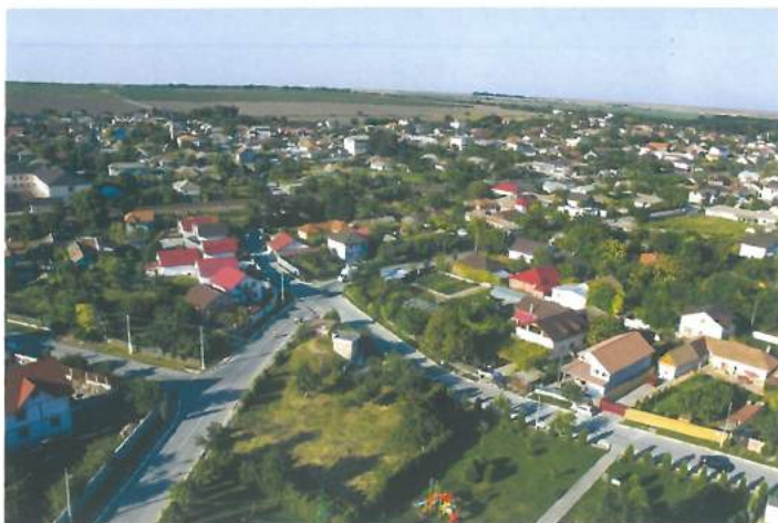
Imagine de ansamblu / Overview