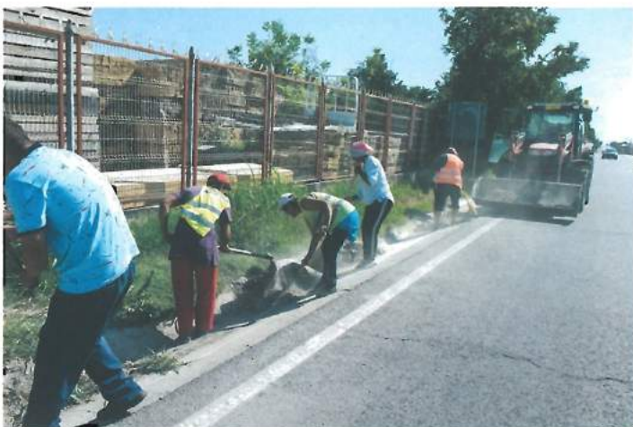
Curățare rigole prin SRL primărie / Cleaning of gutters by the Town Hall LLC