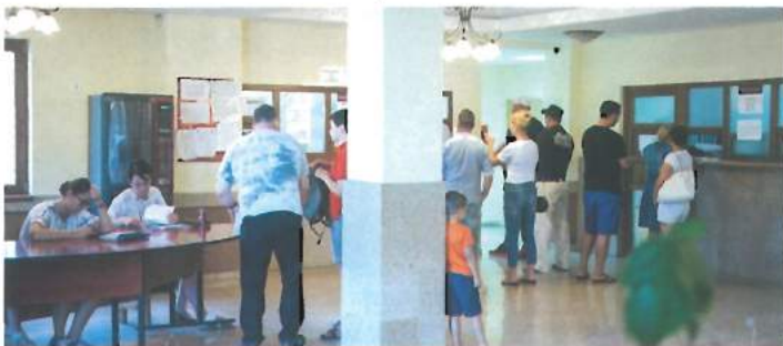
Interior primărie / Interior of the Town Hall 80