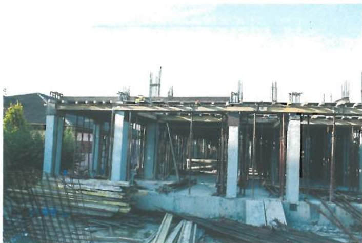
Santier sală de sport în curtea Școlii gimnaziale nr. 2 / Construction site of the Sports hall in the courtyard of School no. 2