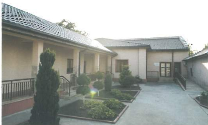
Centru pentru tineret (fonduri externe) / Youth Center (external funds)