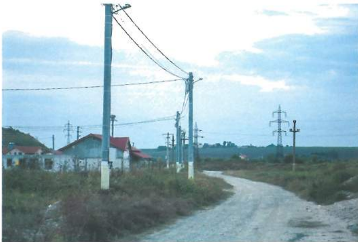
Afumați – Cartier în dezvoltare / Afumati - Developing neighborhood