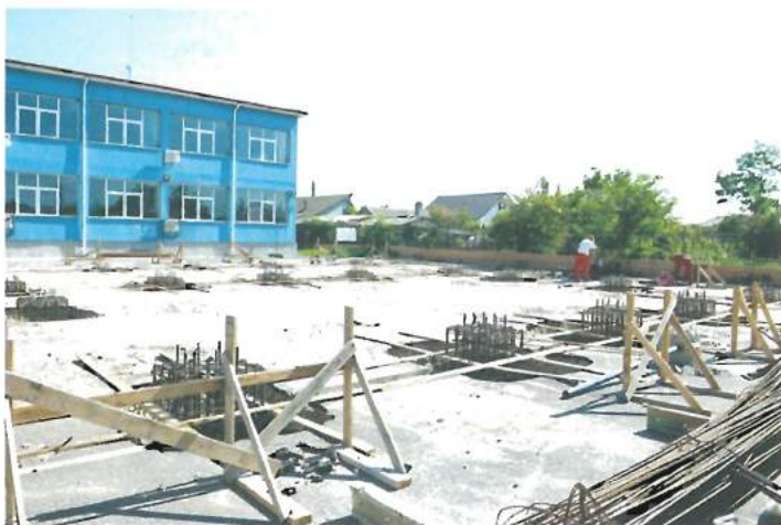
Șantier construire Grădinița cu orar prelungit / Building site of the day nursery