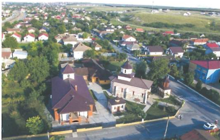
Centru Valea Seacă - privire de ansamblu / Valea Seaca center - overview