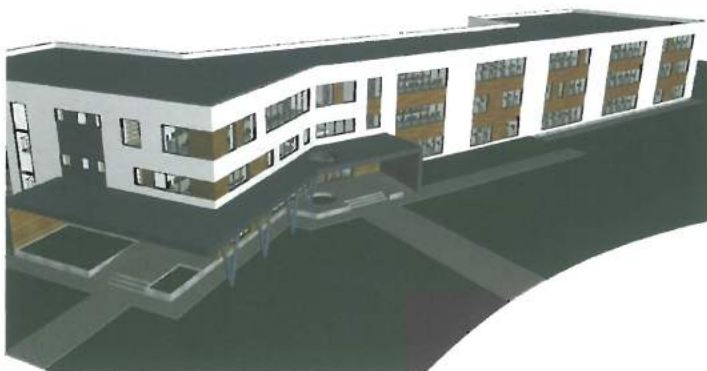
Planșa proiect viitoare școală zona F / Blueprint of F area future school