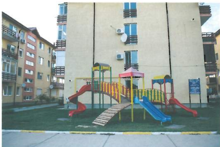
Blocuri ANL (fonduri atrase) / ANL Blocks of flats (attracted funds)