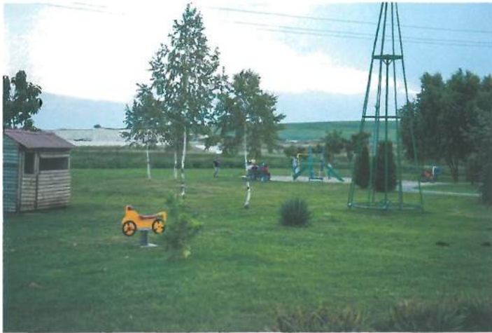
Parc Valea Seacă / Valea Seacă Park