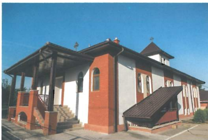
Cantina socială Valea Seacă (buget local) / Valea Seacă social canteen (local budget)