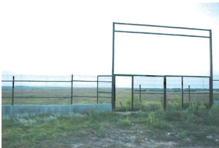
Cimitire noi - musulman și ortodox / New Muslim and Orthodox cemeteries