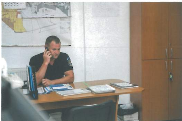
Poliția Locală, dispecerat 24/7 - 0733002124 / Local Police, 24/7 dispatching center - 0733002124