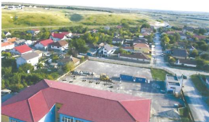
Privire de ansamblu Valea Seacă / Valea Seaca overview