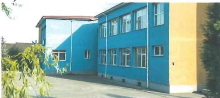
Școala Gimnazială nr. 2 / School no. 2