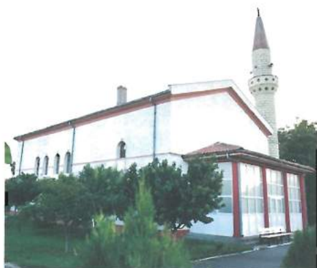
Geamia Nouă Valu lui Traian (partial buget local) / Valu lui Traian New Mosque (partly from local budget resources)