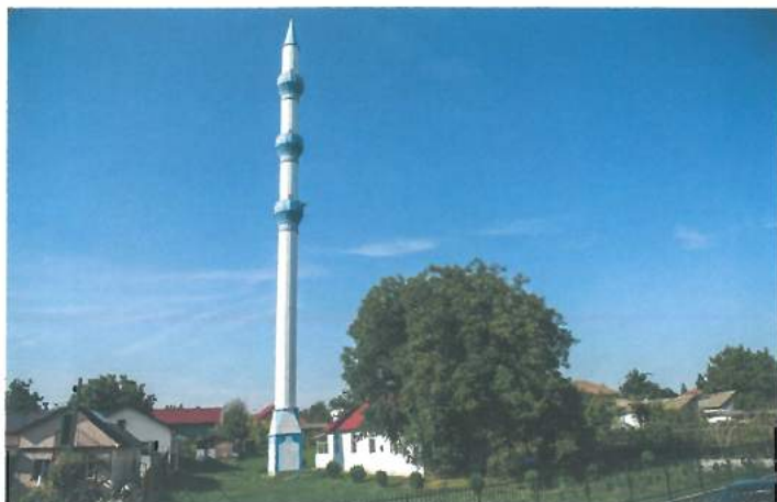
Geamia Veche Valu lui Traian (buget local) / Valu lui Traian Old Mosque (local budget resources)