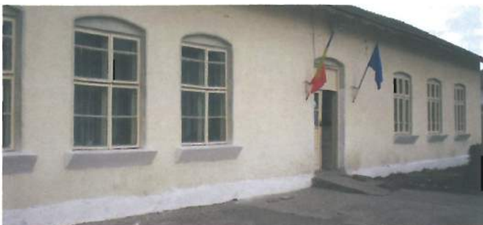
Așa arăta în 2004 înaintea perioadei de modernizare Școala Valea Seacă / This is how Valea Seaca School used to look like before the modernization period