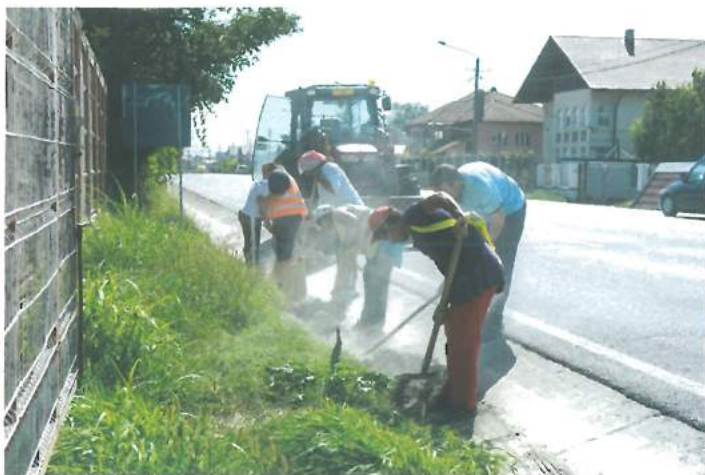
Activități curente SRL primărie / Current activities performed by the Town Hall LLC