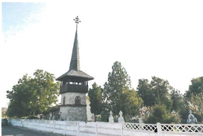
Biserica Sf. Petru și Pavel (buget local) / St. Peter and Paul Church (local budget)