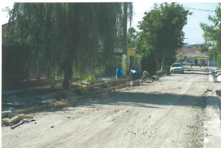
Sistematizare drumuri / Road planning