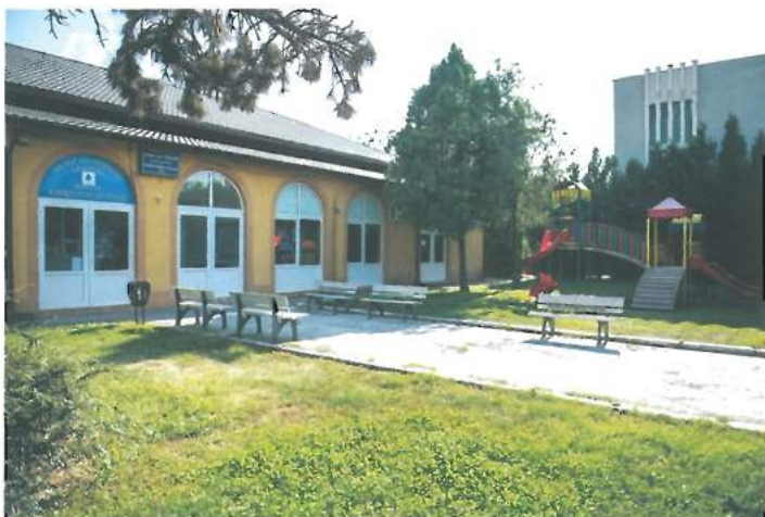
Cămin Cultural Valu lui Traian - construit cu fonduri externe si reabilitat din buget local /