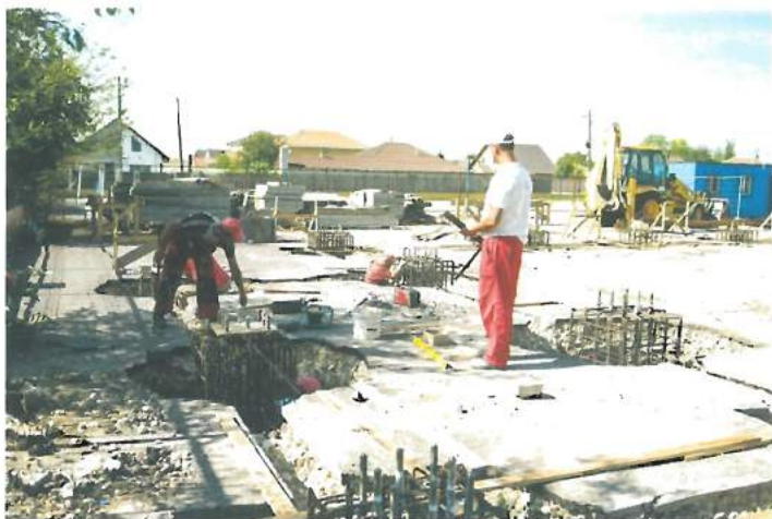
Șantier sală de sport în curtea Școlii gimnaziale nr. 2 / Construction site of the Sports hall in the courtyard of School no. 2