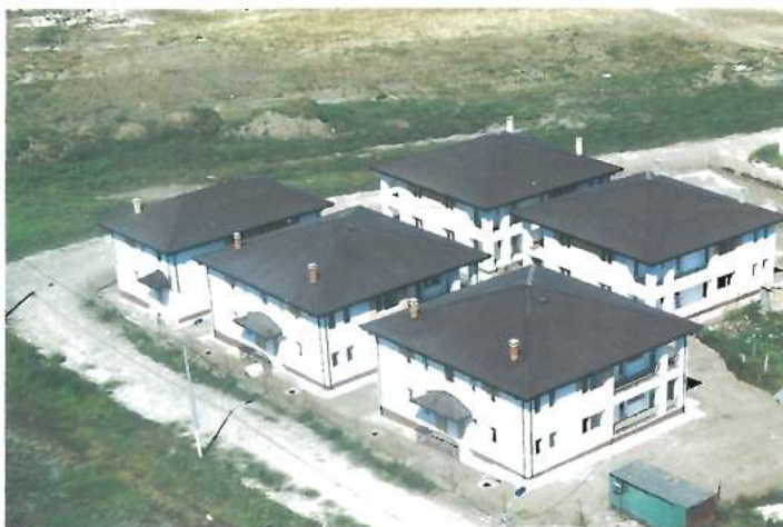
Locuințe sociale / Social housing