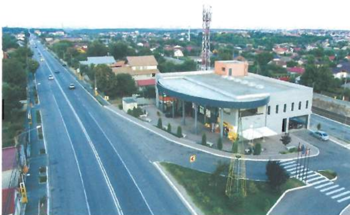
Piața agro-alimentară (fonduri externe) / Agro-Food Market (external funds)