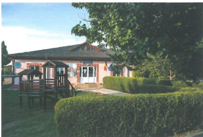
Grădinița Valea Seacă / Valea Seaca Kindergarten