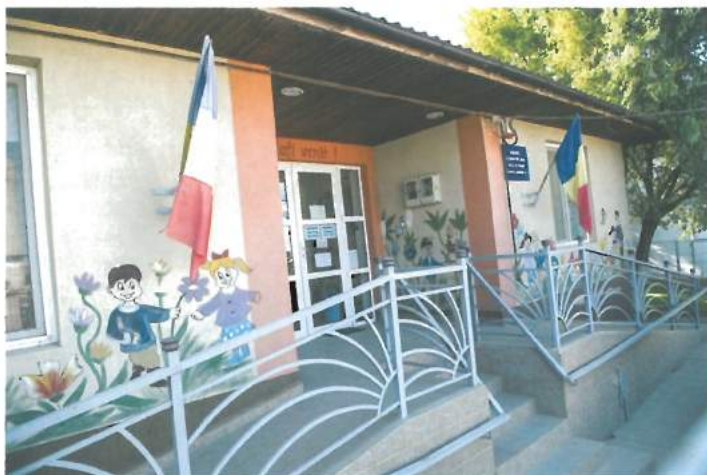
Grădinița cu program prelungit Zona C - parțial buget local / Day nursery in C area – partly from local budget resources