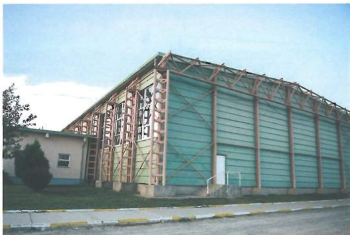
Sala de sport (fonduri externe) / The Sports Hall (external funds)