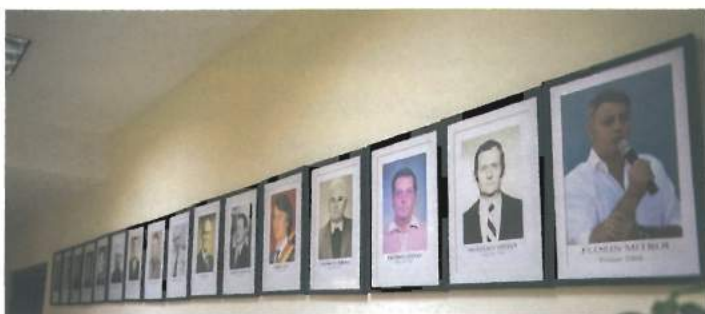
La etajul primăriei sunt expuse fotografii cu toți primarii din 1932 până în prezent / The floor of the mayoralty hosts photos of all mayors from 1932 until present.