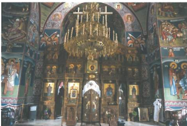
Biserica Sf. Parascheva (interior) / St. Parascheva Church (interior)