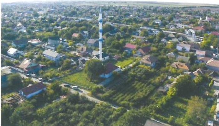
Minaretul Valu lui Traian – cel mai înalt din județ / Valu lui Traian Minaret - the highest in the county