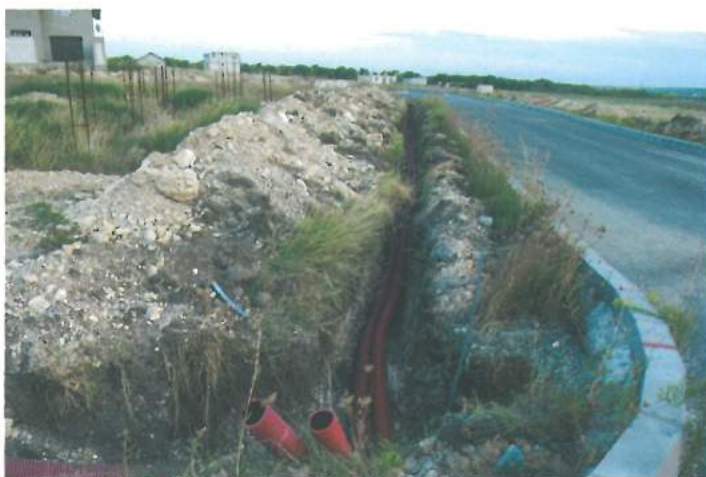
Introducere rețea electrică pentru consum casnic în cartierul nou al comunei – Zona F /

Setting of a household electricity network in the new neighborhood of the township – F Area