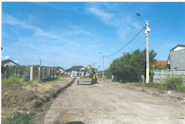
Santier drumuri / Road construction site