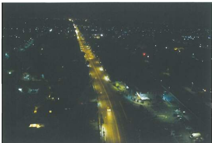
Valu nocturn / Valu at night