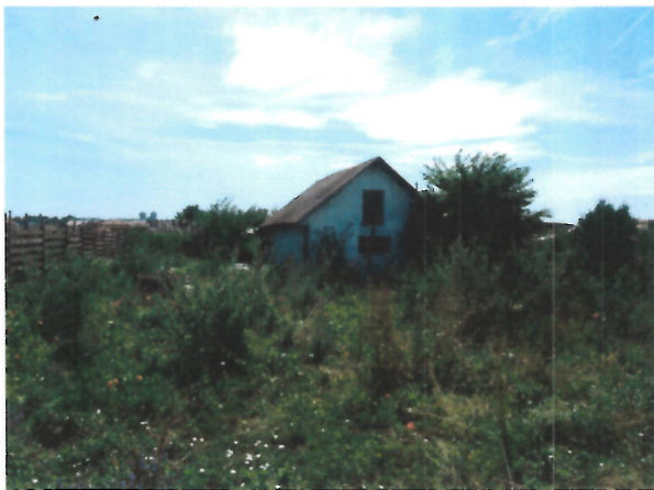
Vedere proprietate evaluata- grajd