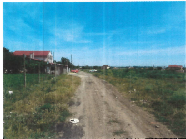
Cale de acces si vecinatati