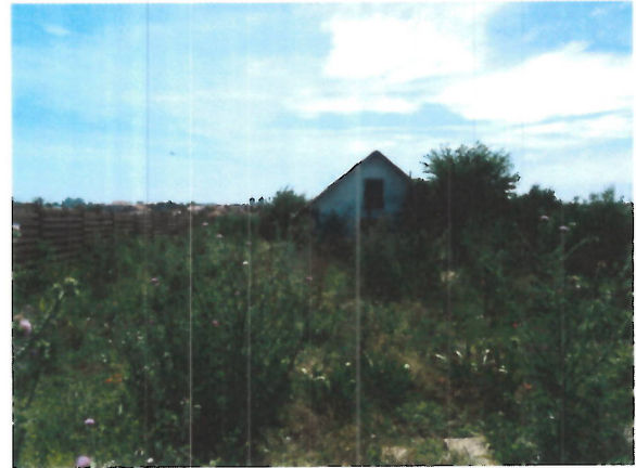
Vedere generala proprietate