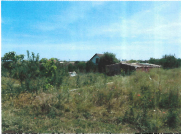
Vedere generala proprietate