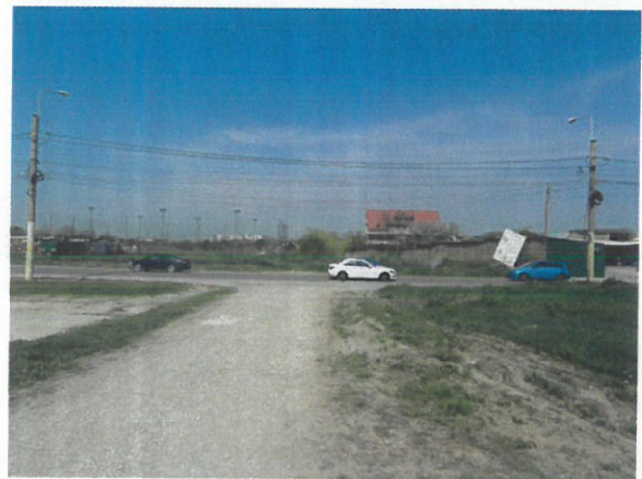
Vedere generala cai de acces