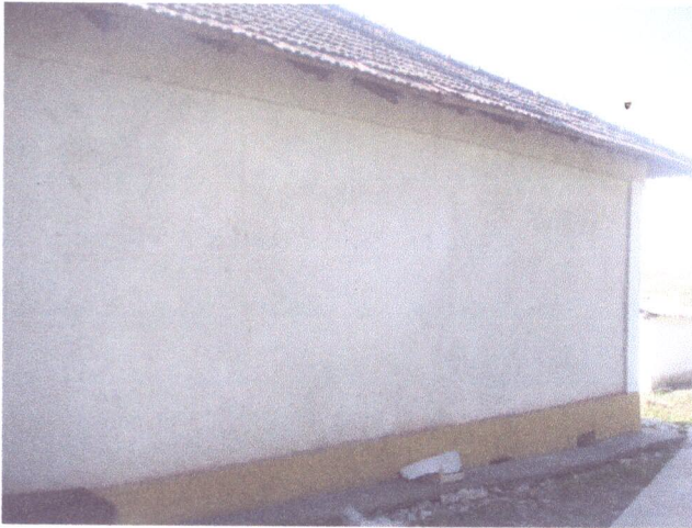
Vedere exterioara proprietate