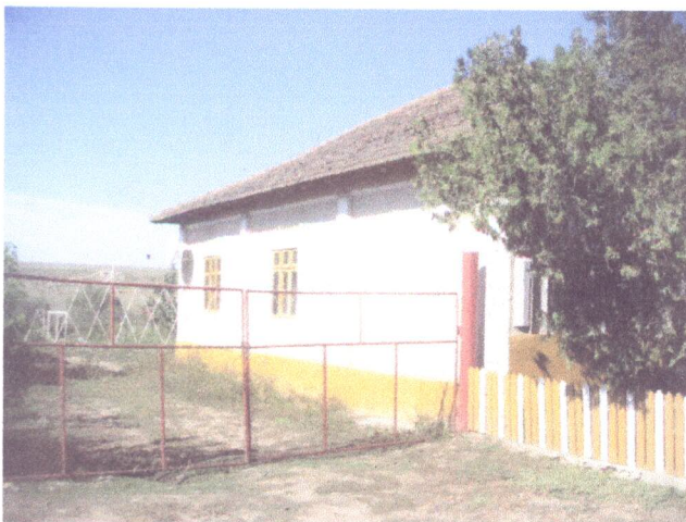
Vedere exterioara proprietate