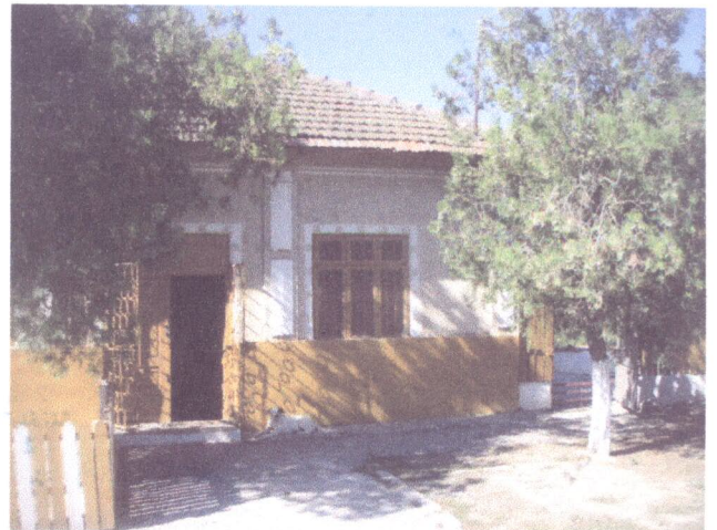
Vedere exterioara proprietate