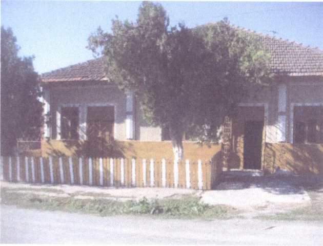
Vedere exterioara proprietate