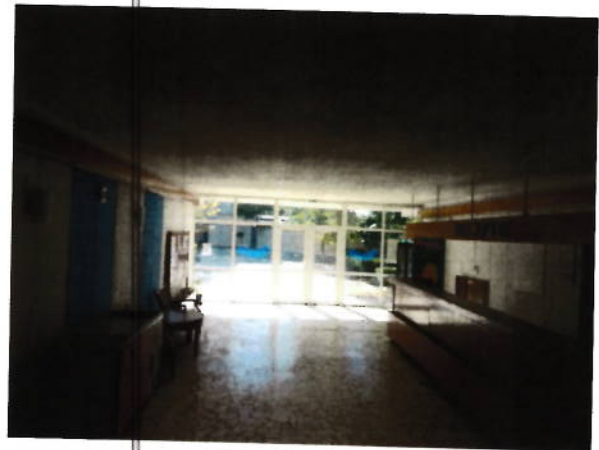
Parter- zona receptie