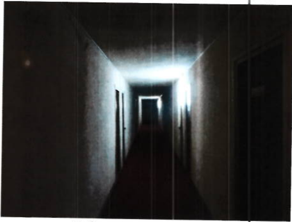
Hol acces camere parter