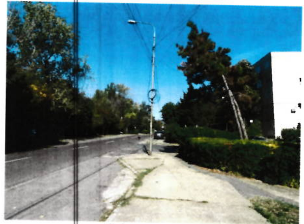
Cale acces – str Plopilor