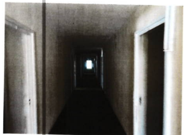
Hol acces camere