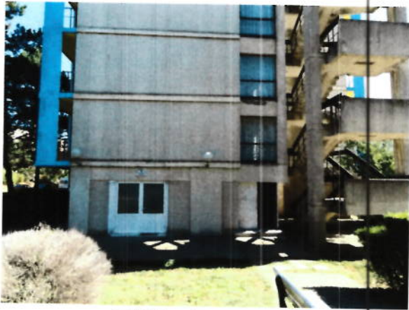
Capela – acces separat