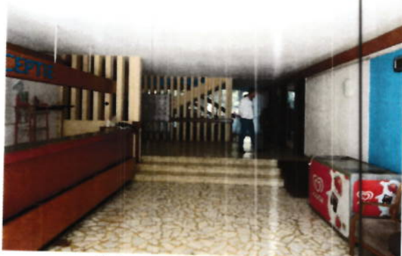
Hol parter si zona receptie