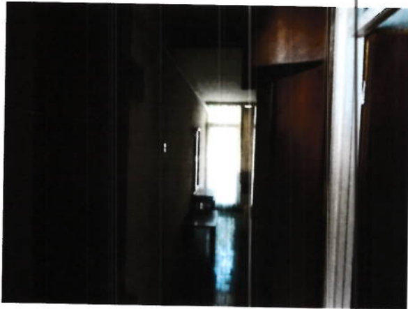
Interior camera cazare