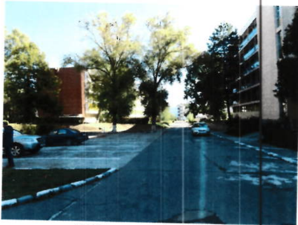
Vedere generala parcare