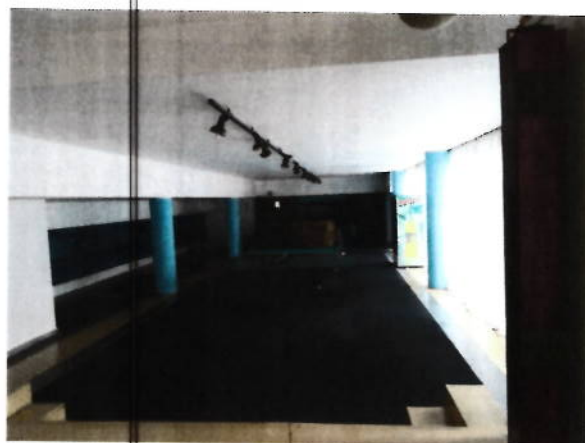
Parter- zona hol intrare