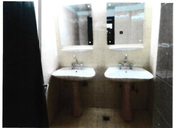
Interior grupuri sanitare parter