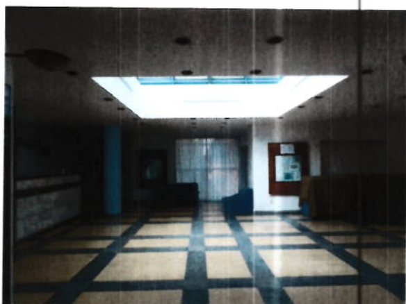
Hol parter si zona receptie