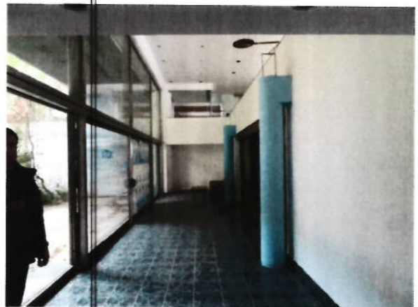
Hol acces club de noapte