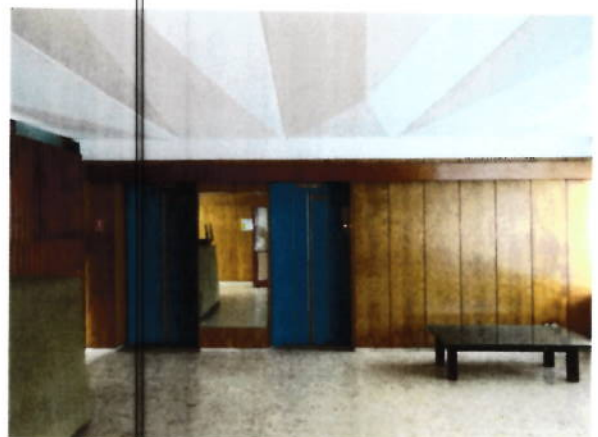
Hol casa scarii