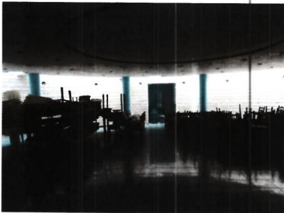
Interior club de noapte