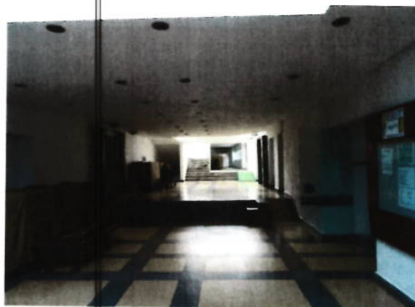
Hol parter si zona receptie