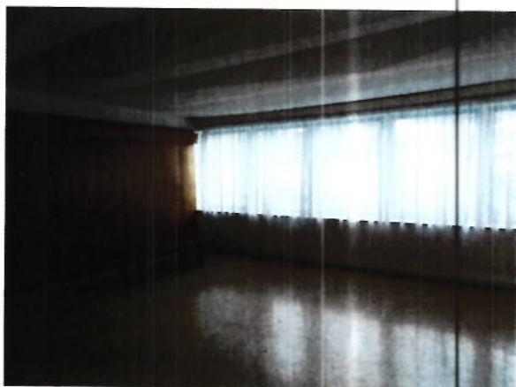
Hol acces camere cazare