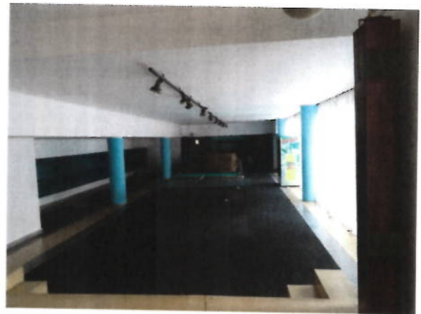
Parter- zona hol intrare