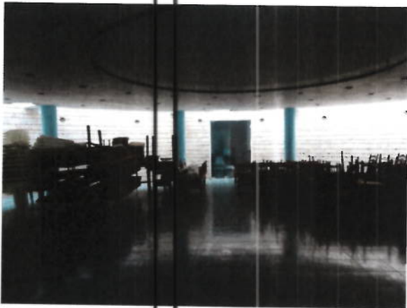
Interior club de noapte