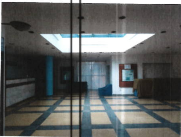
Hol parter si zona receptie