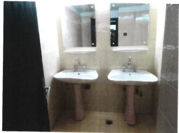
Interior grupuri sanitare parter