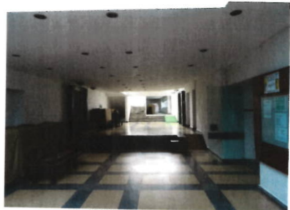
Hol parter si zona receptie