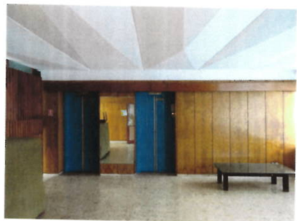
Hol casa scarii