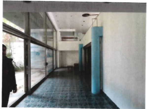
Hol acces club de noapte