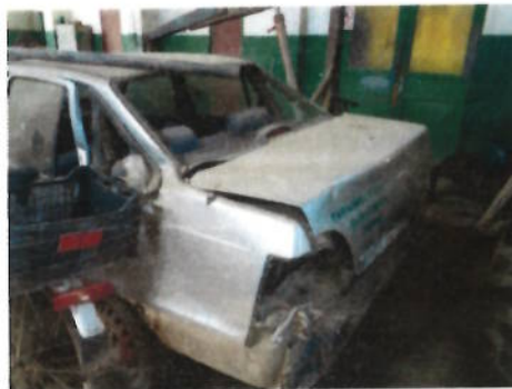
Autoturism Daewoo Cielo, CT-10-AVN