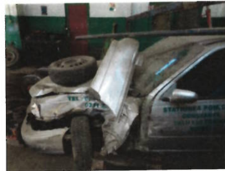
Autoturism Daewoo Cielo, CT-10-AVN