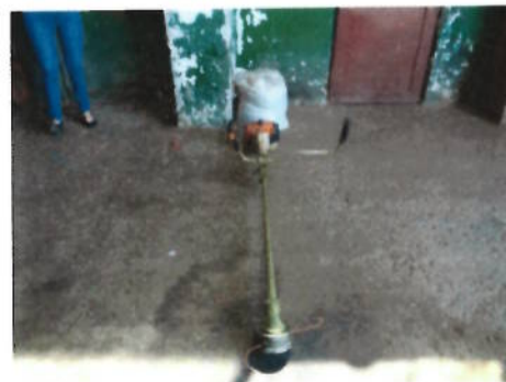
Masina taiat iarba Stihl FS 300