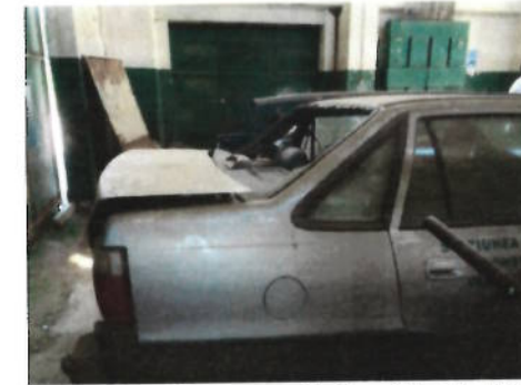
Autoturism Daewoo Cielo, CT-10-AVN