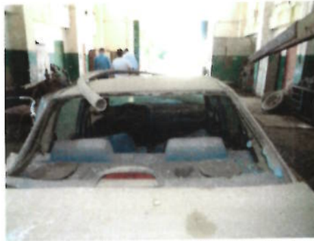
Autoturism Daewoo Cielo, CT-10-AVN