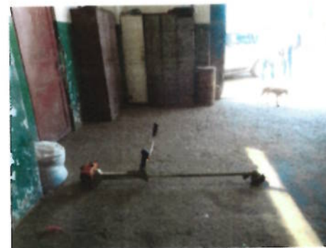
Masina taiat iarba Stihl FS 300