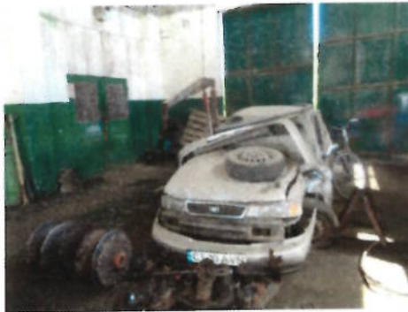
Autoturism Daewoo Cielo, CT-10-AVN