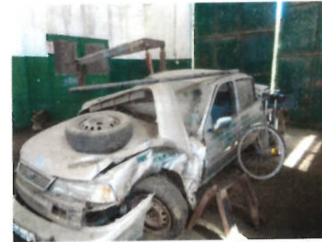
Autoturism Daewoo Cielo, CT-10-AVN