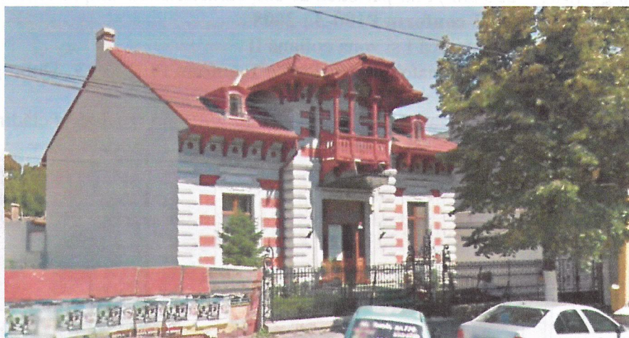
Fotografie August 2014

De menționat că imobilul supus analizei se află înscris în lista monumentelor de categoria B la poziția 1904 CT-II-m-B-21100 "casa Ion Bănescu" prin Ordinul nr.2572/13.08.2014 al Ministerului Culturii și publicat în Monitorul Oficial nr.736 din 09 octombrie 2014.