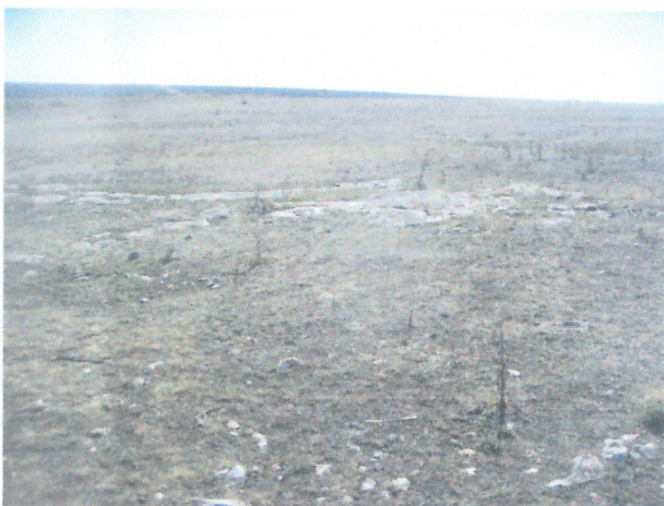
Vedere generala proprietate