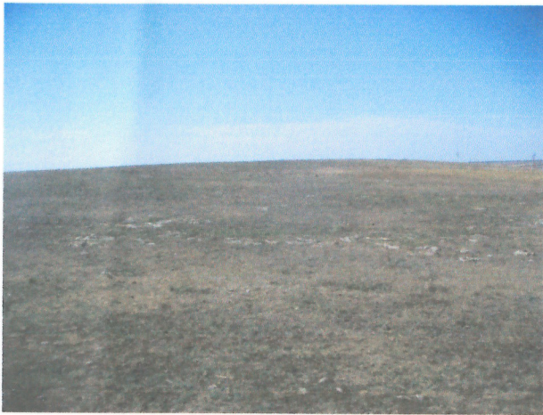
Vedere generala proprietate