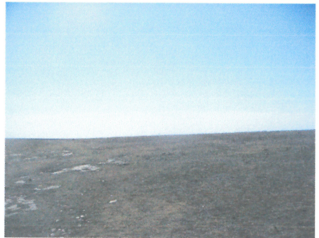
Vedere generala proprietate