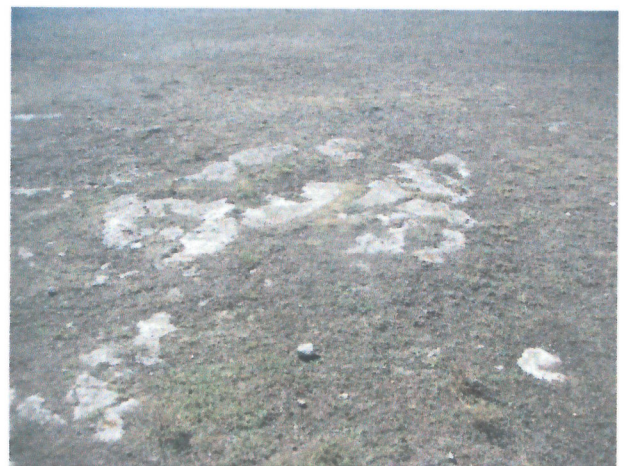
Vedere generala proprietate