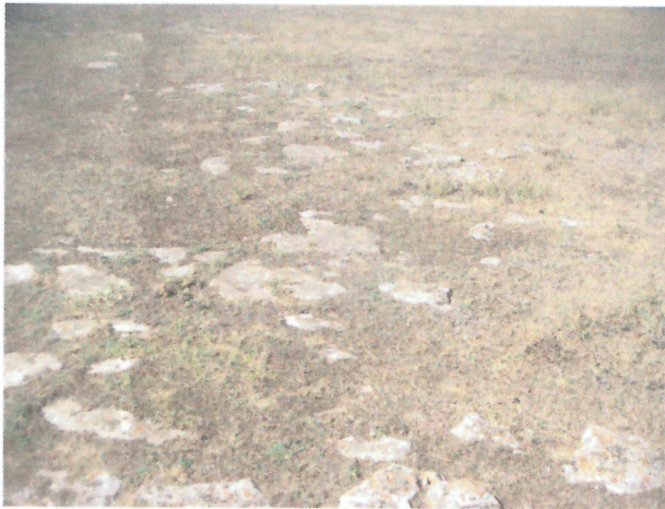
Vedere generala proprietate