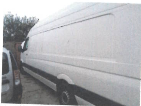
Autoutilitara Volkswagen Crafter 2 EKE2, CT-04-ELX