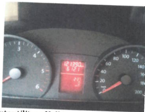
Autoutilitara Volkswagen Crafter 2FJE2 , CT-06-ELX