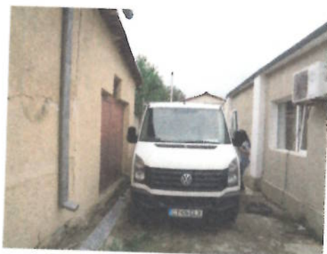
Autoutilitara Volkswagen Crafter 2FJE2 , CT-06-ELX