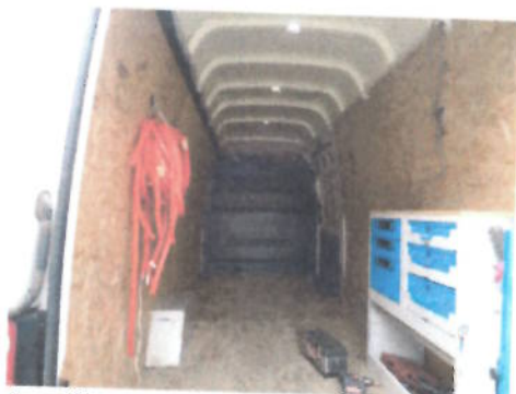
Autoutilitara Volkswagen Crafter 2 EKE2, CT-04-ELX