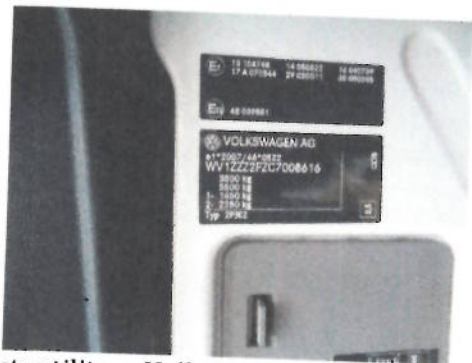
Autoutilitara Volkswagen Crafter 2FJE2 , CT-06-ELX