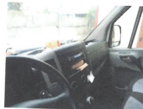
Autoutilitara Volkswagen Crafter 2 EKE2, CT-04-ELX