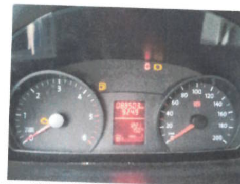
Autoutilitara Volkswagen Crafter 2 EKE2, CT-04-ELX