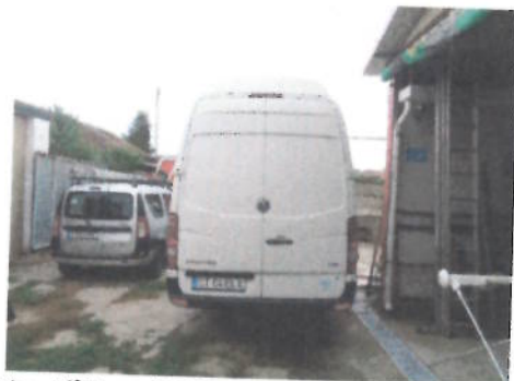
Autoutilitara Volkswagen Crafter 2 EKE2, CT-04-ELX