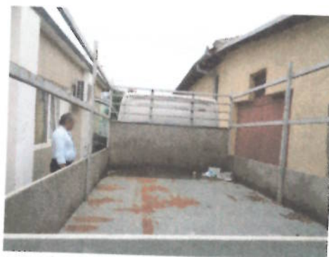
Autoutilitara Volkswagen Crafter 2FJE2 , CT-06-ELX