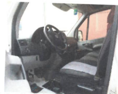
Autoutilitara Volkswagen Crafter 2FJE2 , CT-06-ELX