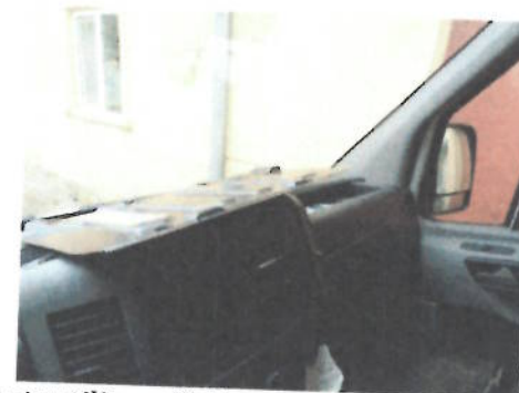
Autoutilitara Volkswagen Crafter 2FJE2 , CT-06-ELX