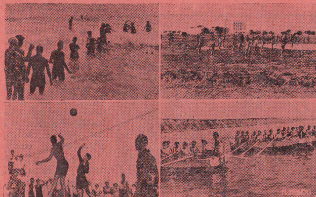
Sport — La vie en plein air — Tourism Foto Vesa

Siège central : BUCAREST, I. Calea Victoriei No. 52 (Pasagiul Englisch) Roumanie - Telefon 331/48