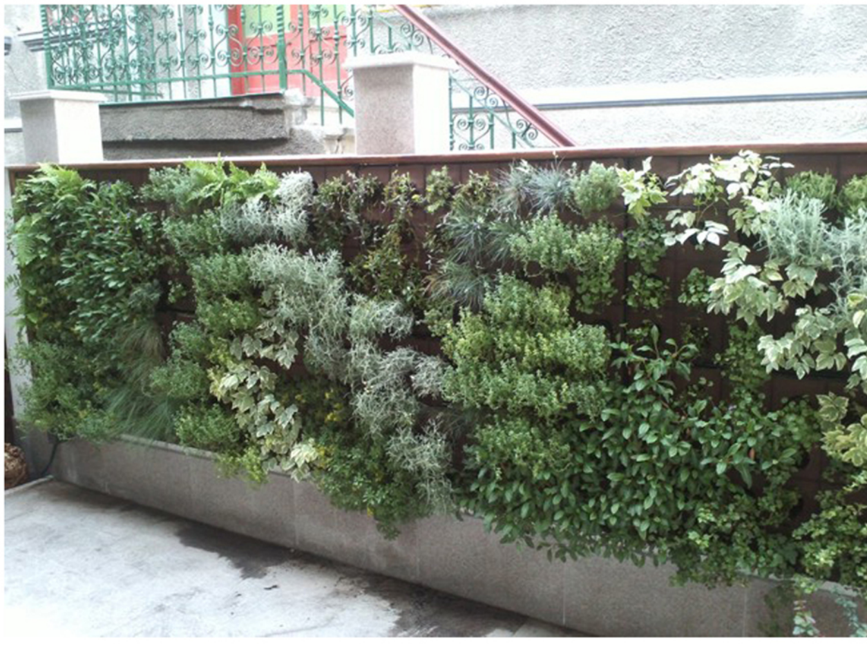
DETALIU PLASNTARE VERTICALA