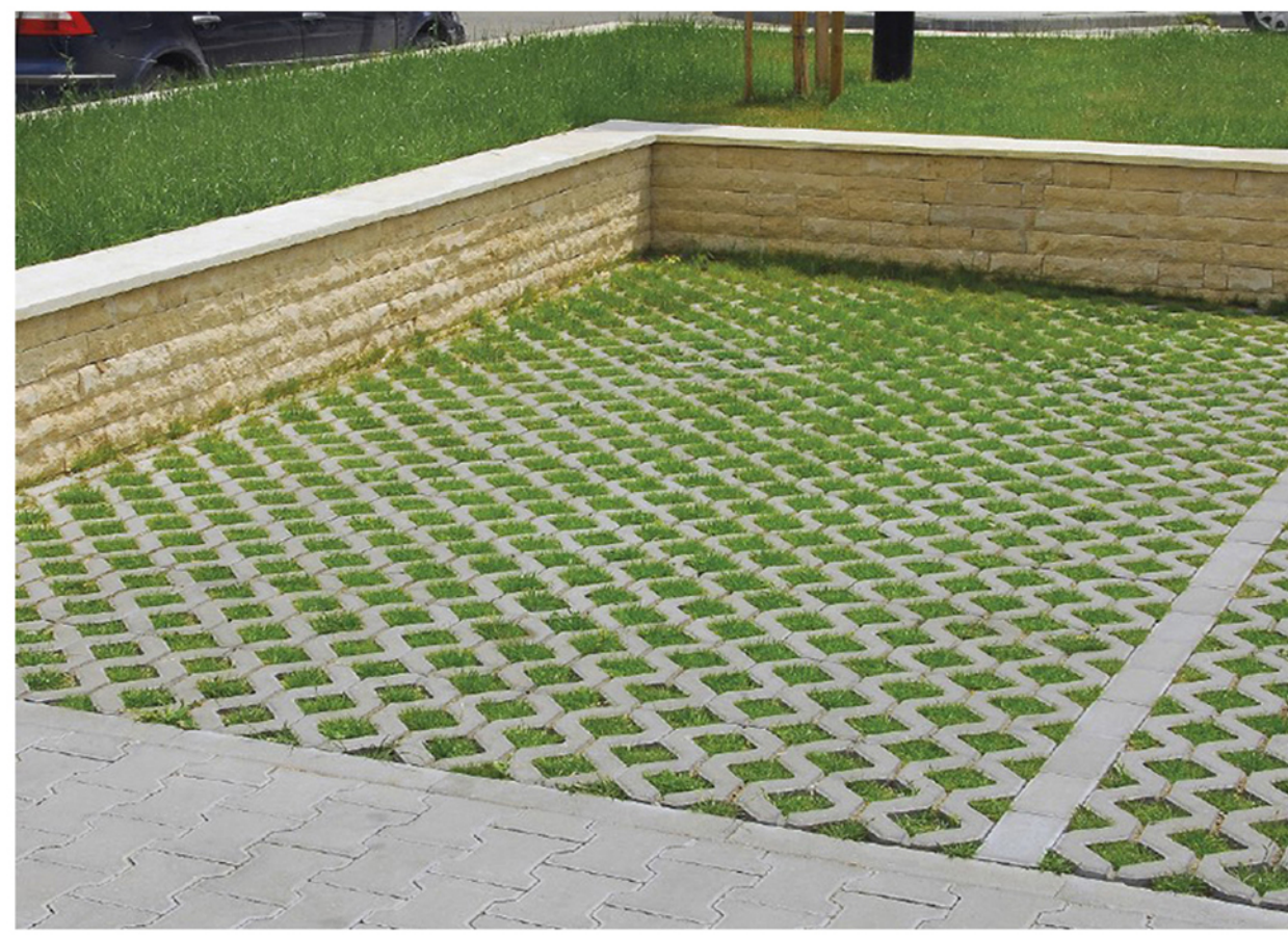
DETALIU PAVAJ INIERBAT