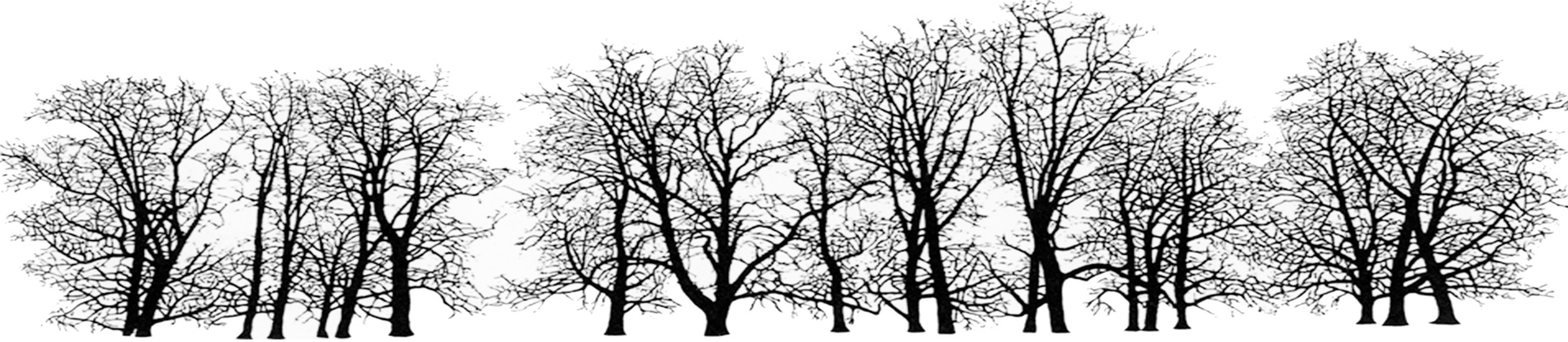
PERDEA PROTECTIE TUJA OCCIDENTALIS