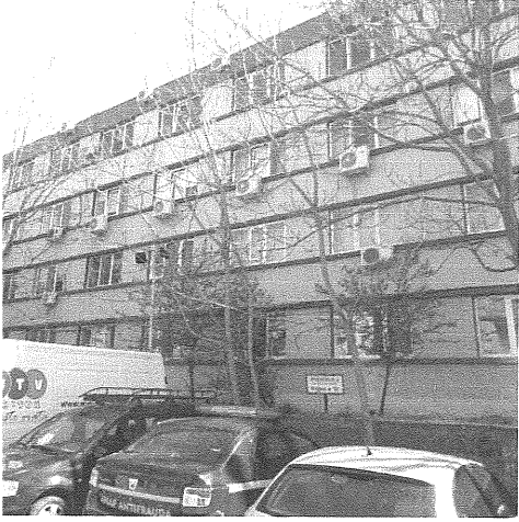
Vedere exterioara proprietate