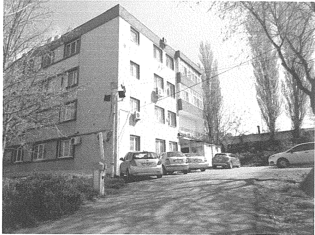
Vedere exterioara proprietate