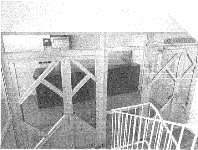
Acces etaj 2