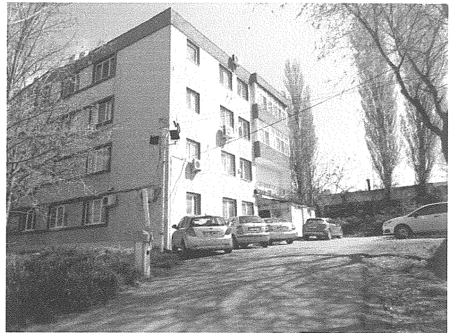
Vedere exterioara proprietate