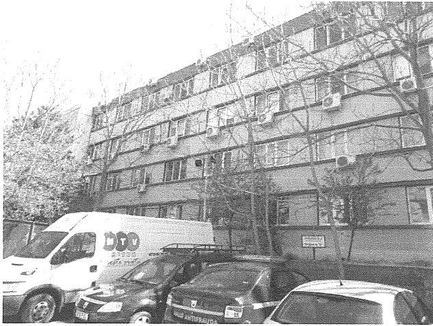
Vedere exterioara proprietate