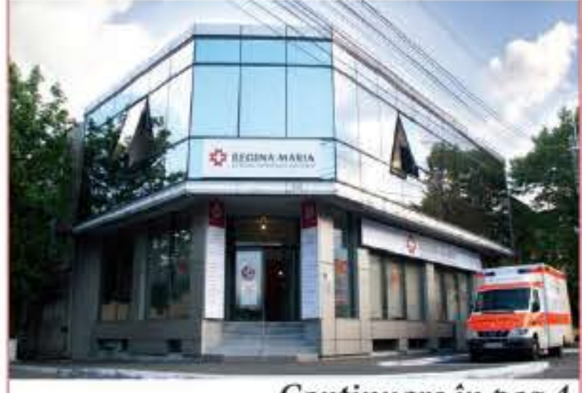
Continuare în pag.4

Anunță deschiderea unui Centru pentru Sănătatea Femeii și a Copilului