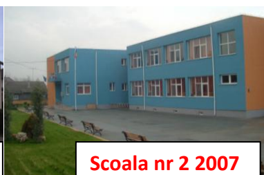
Scoala nr 2 2007