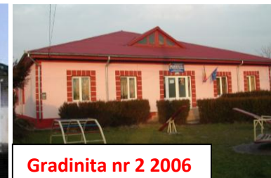
Gradinita nr 2 2006