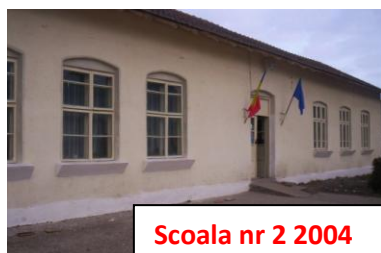
Scoala nr 2 2004