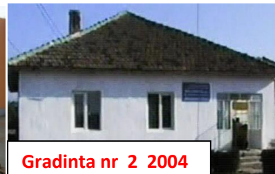
Gradinta nr 2 2004