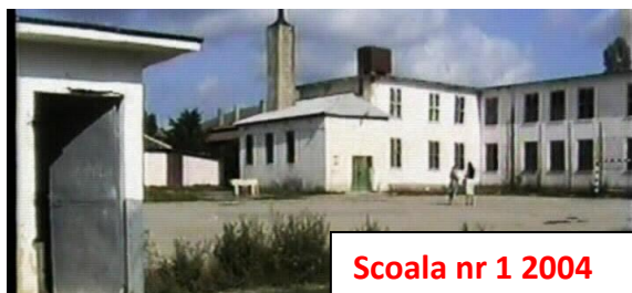
Scoala nr 1 2004