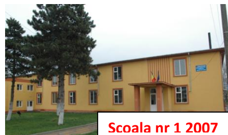
Scoala nr 1 2007