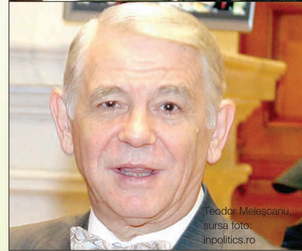
Teodor Meleșcanu, sursa foto: inpolitics.ro