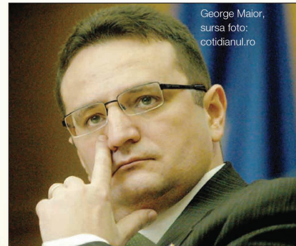
George Maior

Singurul lucru care nu este secret când vine vorba despre serviciile secrete din România este faptul că ele există și, mai mult, că ne supraveghează viețile, indiferent de cât de lipsiți de importanță am putea crede că suntem. Experiența timpurilor pe care le trăim ne învață că până și cel mai neimportant om poate deveni, printr-o răsturnare de situație fulgerătoare, subiect al unor intens mediatizate „interceptări”, de pildă. Ori, tot experiența ultimelor luni ne arată că doi constănțeni obișnuiți, rătăciți pe câmp, în nămeți, pot deveni și ei subiect de presă, consecință directă a comunicării mai mult sau mai puțin defectuoase dintre aceleași servicii speciale și instituțiile abilitate să salveze vieți. De la SRI, SIE, STS și până la DGPII, DGIA, SPP ori altele din același sector, românii au pierdut șirul serviciilor care, atenție!, le supraveghează viața. Pentru că informația înseamnă putere, dar mai ales pentru respectarea dreptului la o corectă informare a publicului, ZIUA de Constanța vi-i prezintă pe cei care conduc serviciile care ne supraveghează viața.