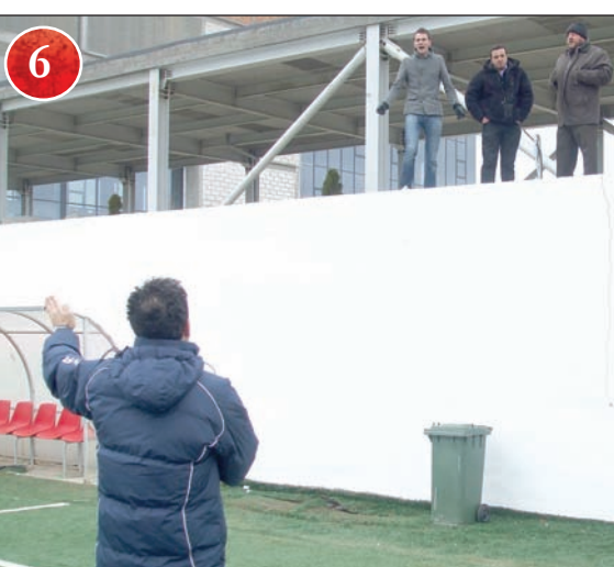
Incredibil - Farul e cu un picior în Liga a III-a! Antrenorul Artimon a plecat