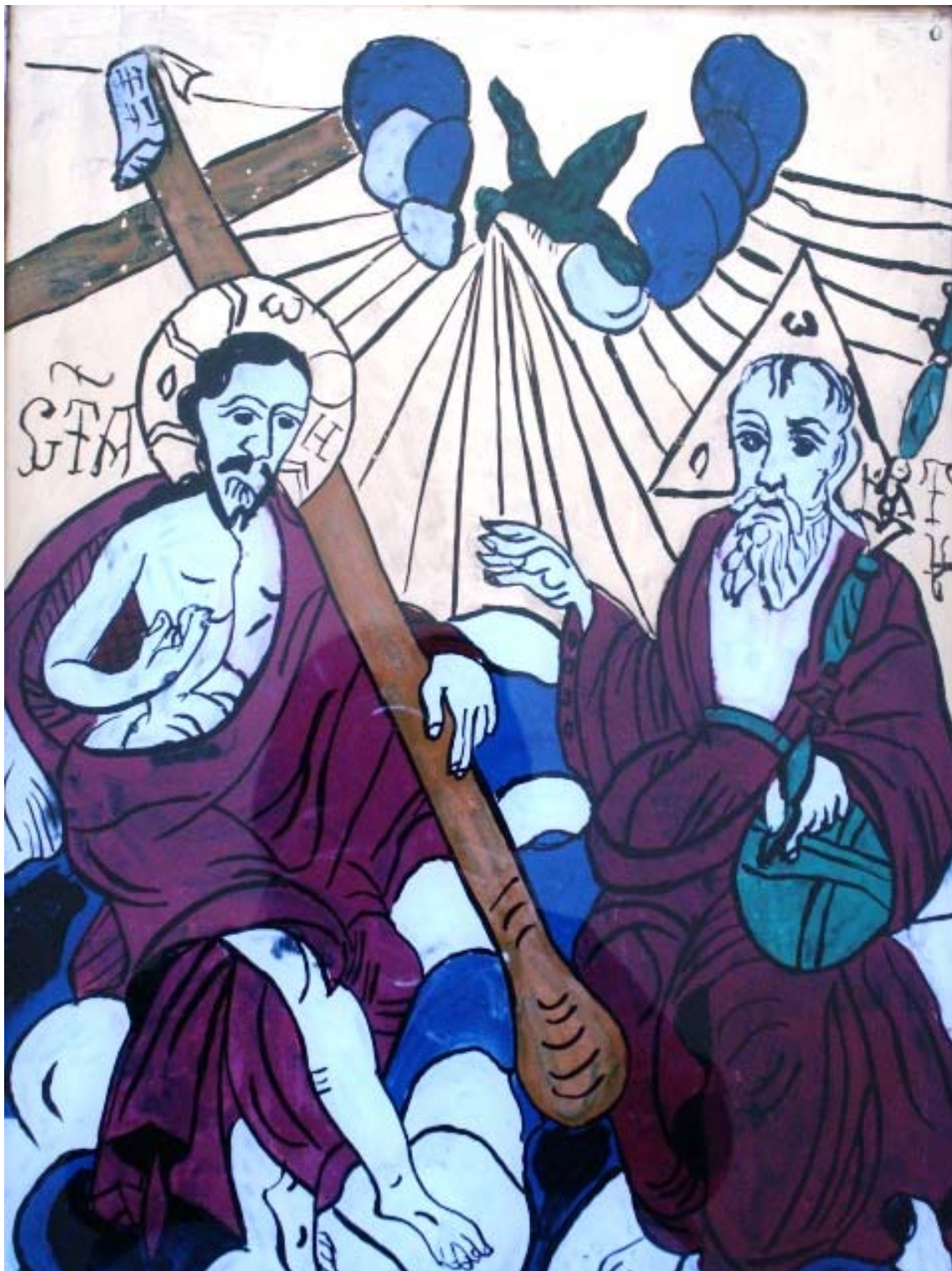
Icoana pe sticla "Sfanta Treime"