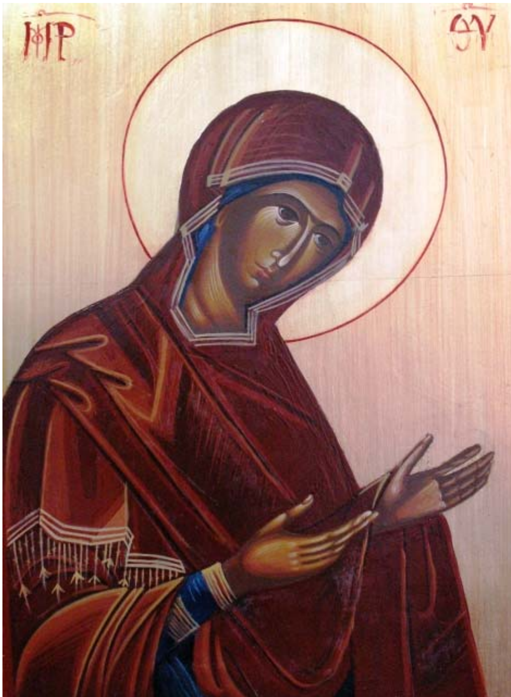
Icoana pe lemn "Maica Domnului"