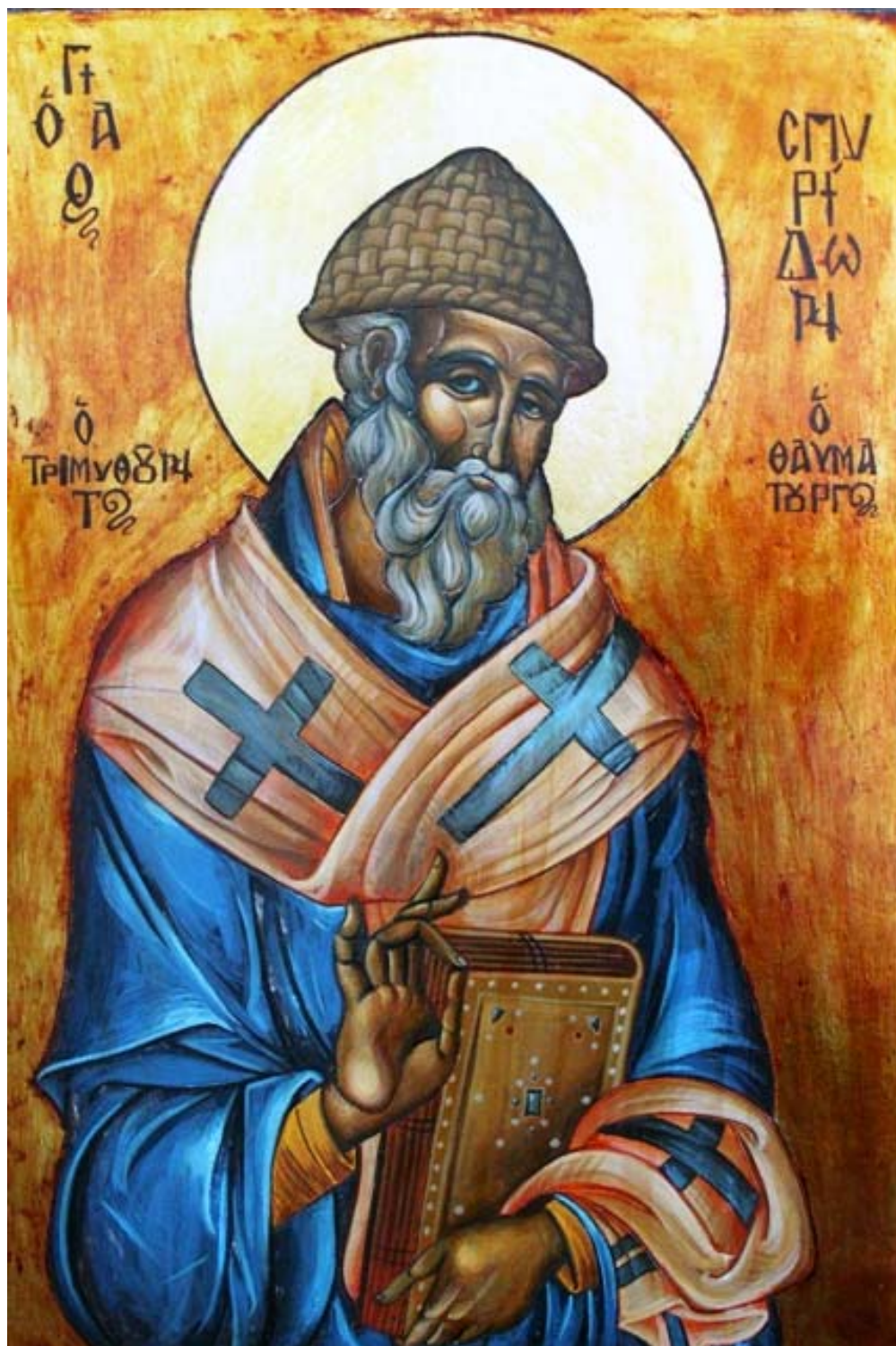
Icoana pe lemn "Sf. Spiridon"