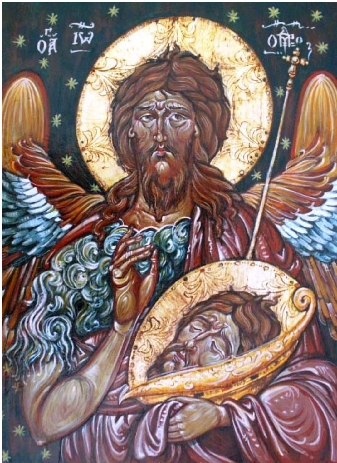
Icoana pe lemn “Sf. Ioan Botezatorul”