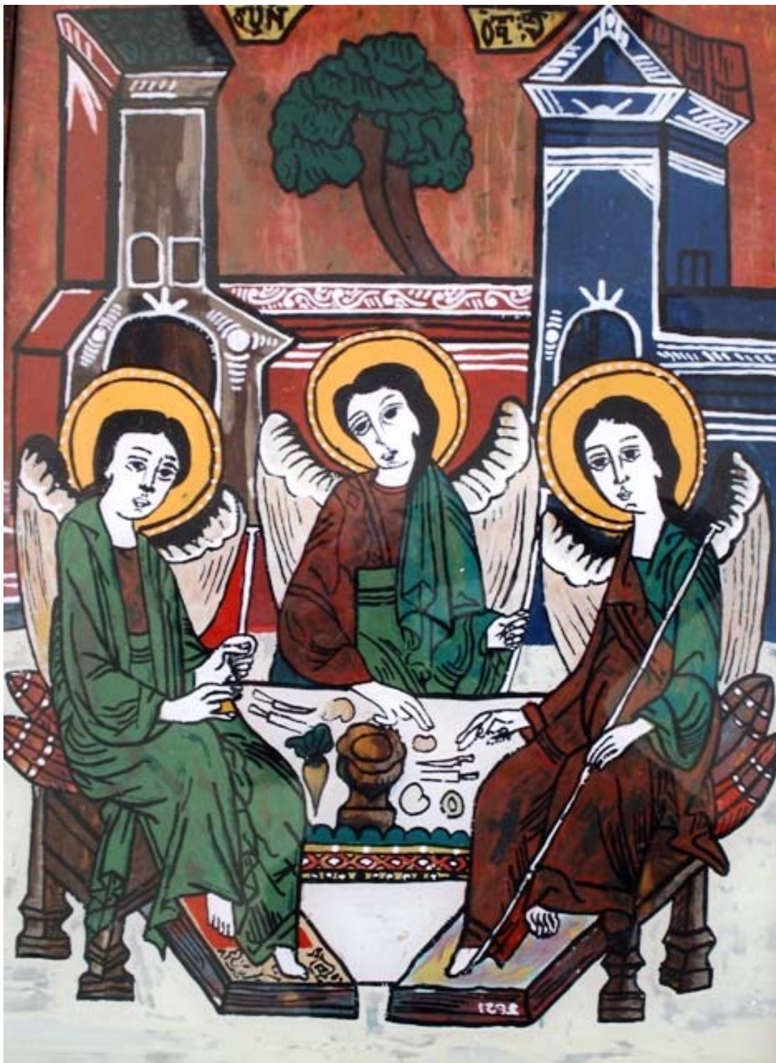
Icoana pe sticla "Sfanta Treime"