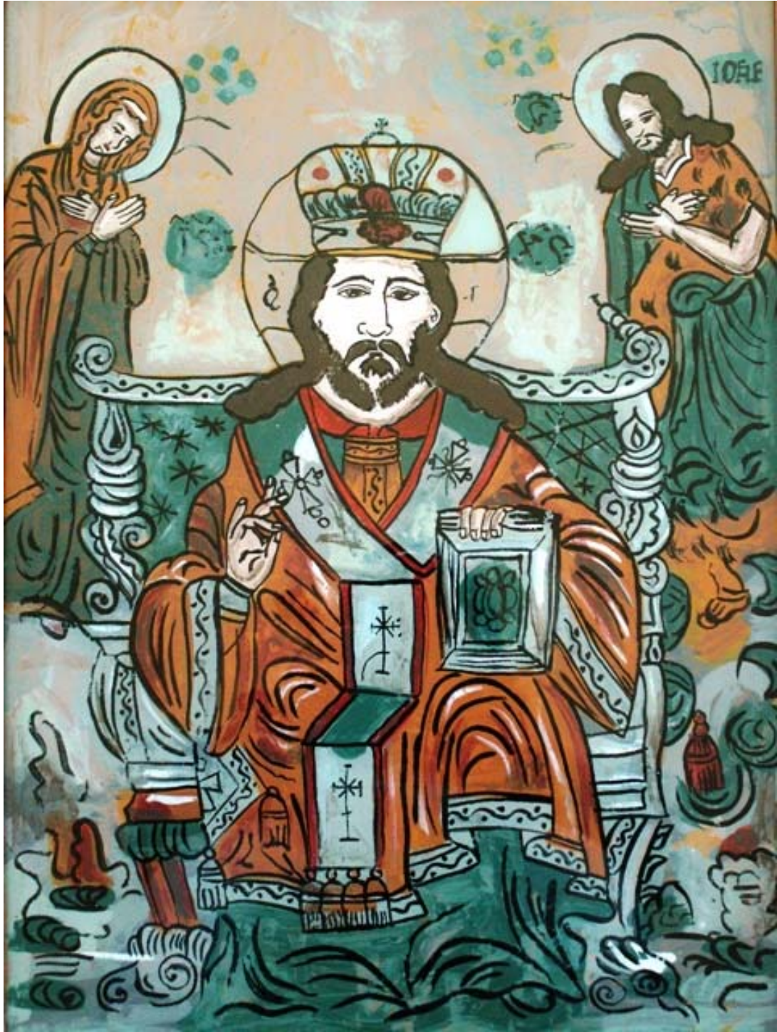
Icoana pe sticla "Deisis"