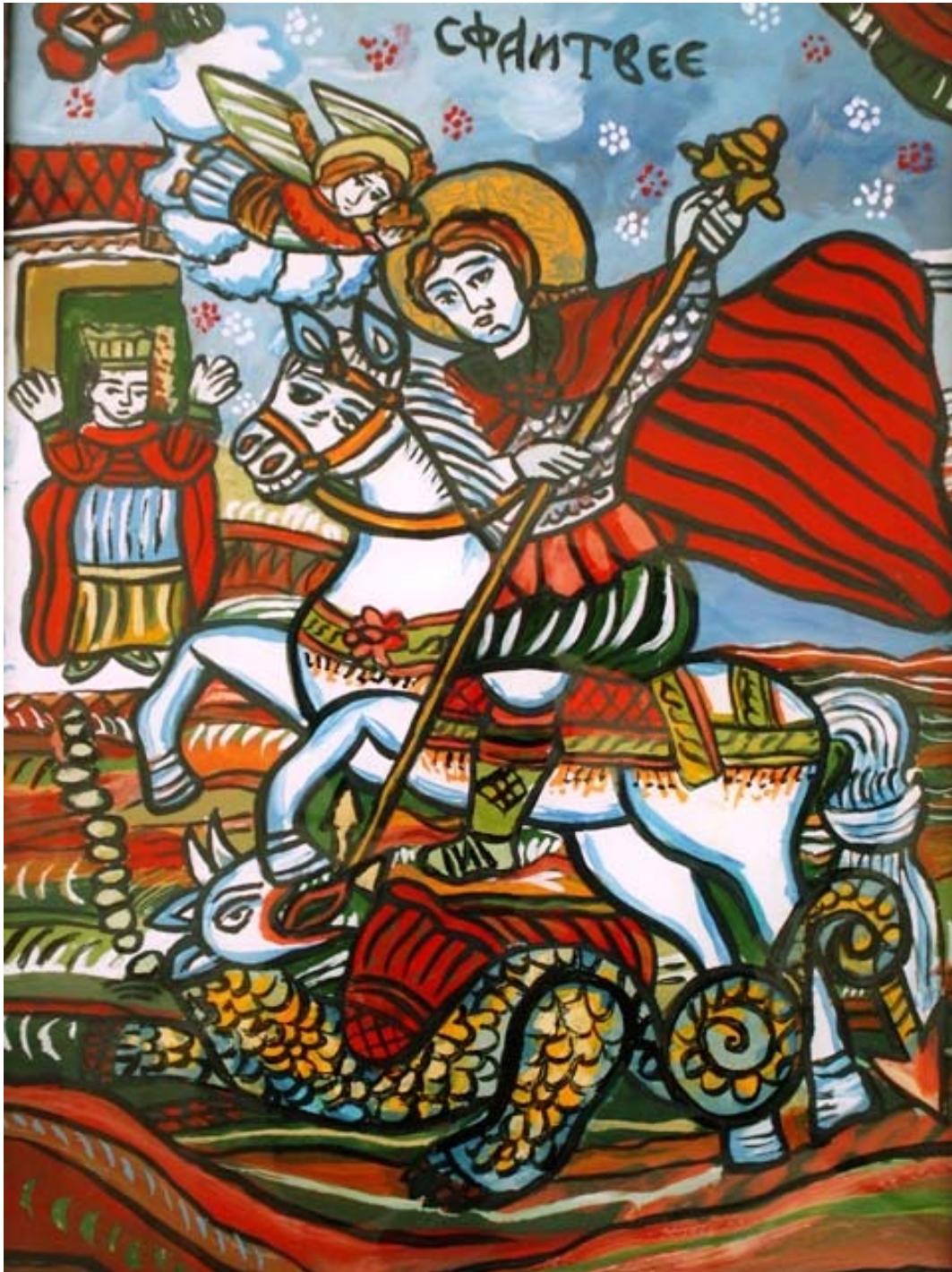
Icoana pe sticla "Sf. Gheorghe"