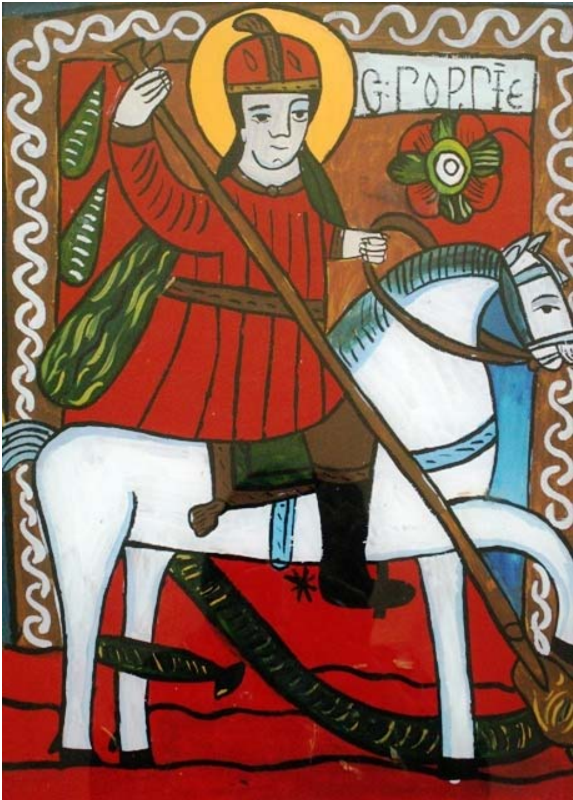
Icoana pe sticla "Sf. Gheorghe"