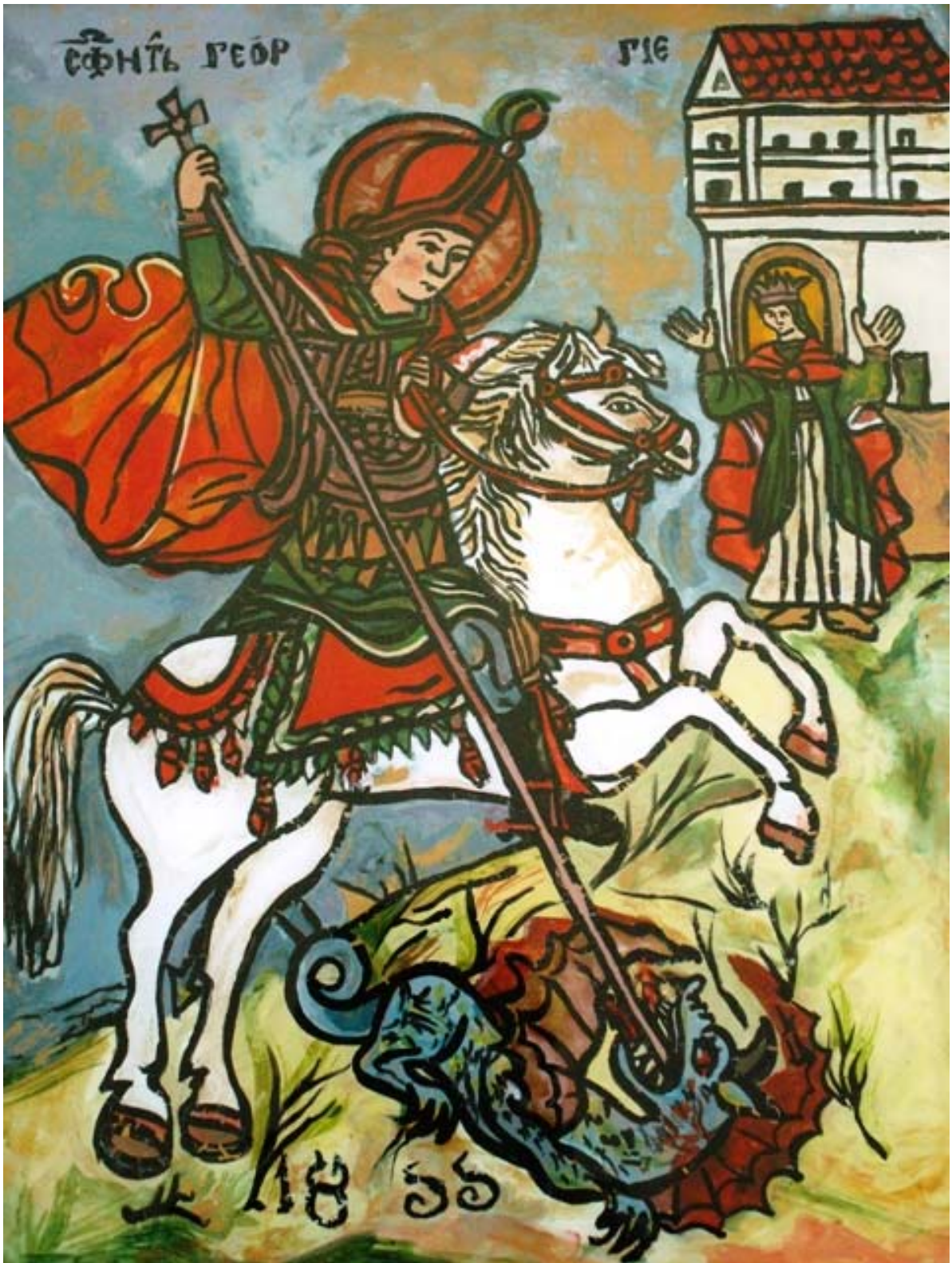
Icoana pe sticla "Sf. Gheorghe"