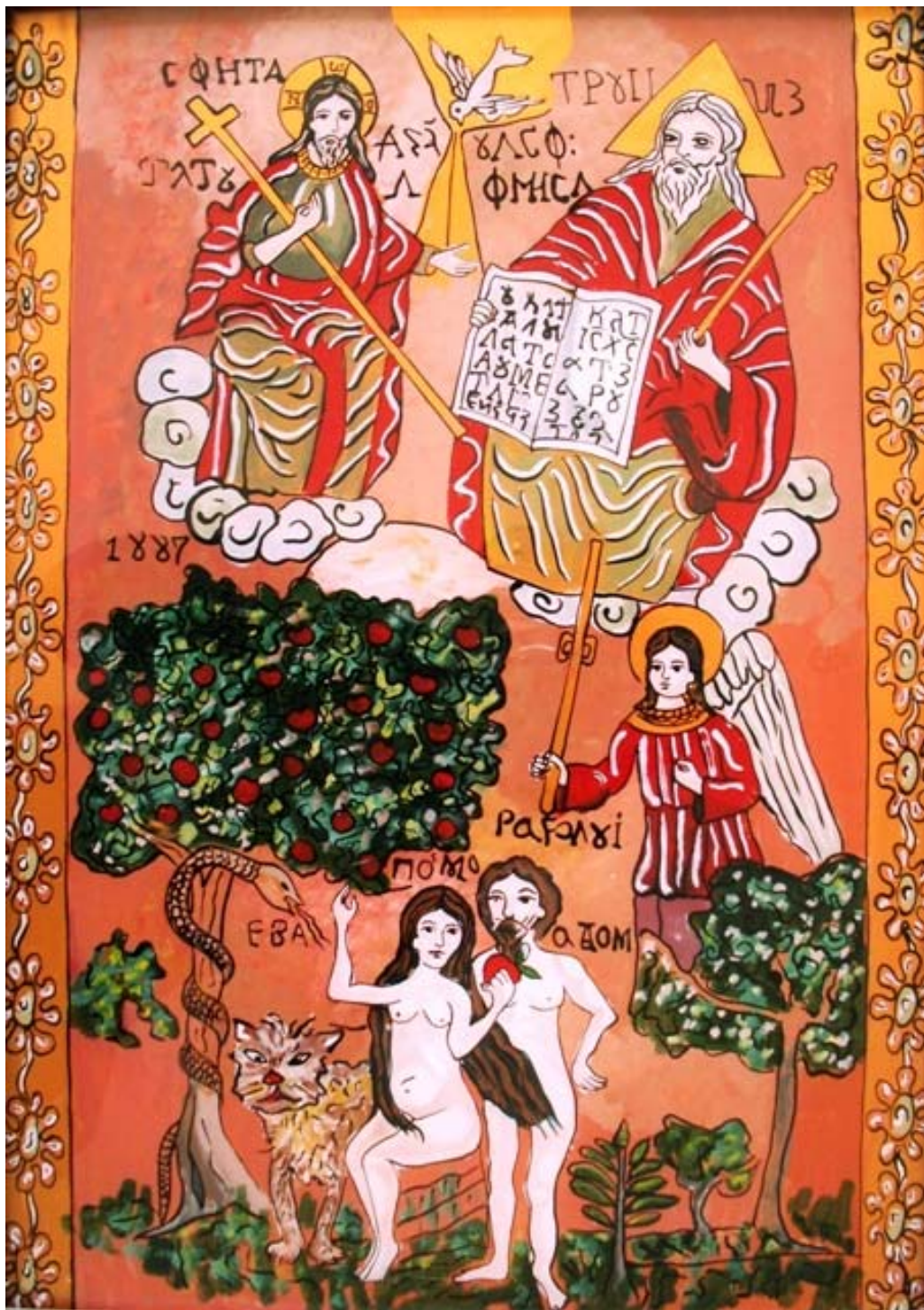
Icoana pe sticla