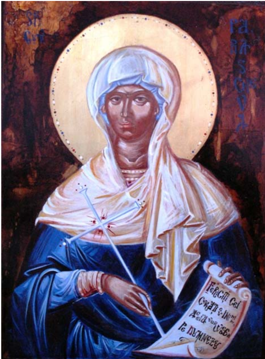
Icoana pe lemn "Sf. Parascheva"