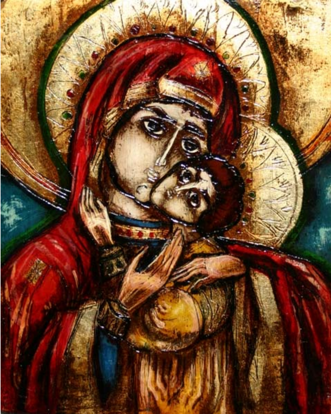
Icoana pe lemn “ Maica Domnului cu Pruncul”

Elev clasa a-X-a , Colegiul National de Arta “Regina Maria”