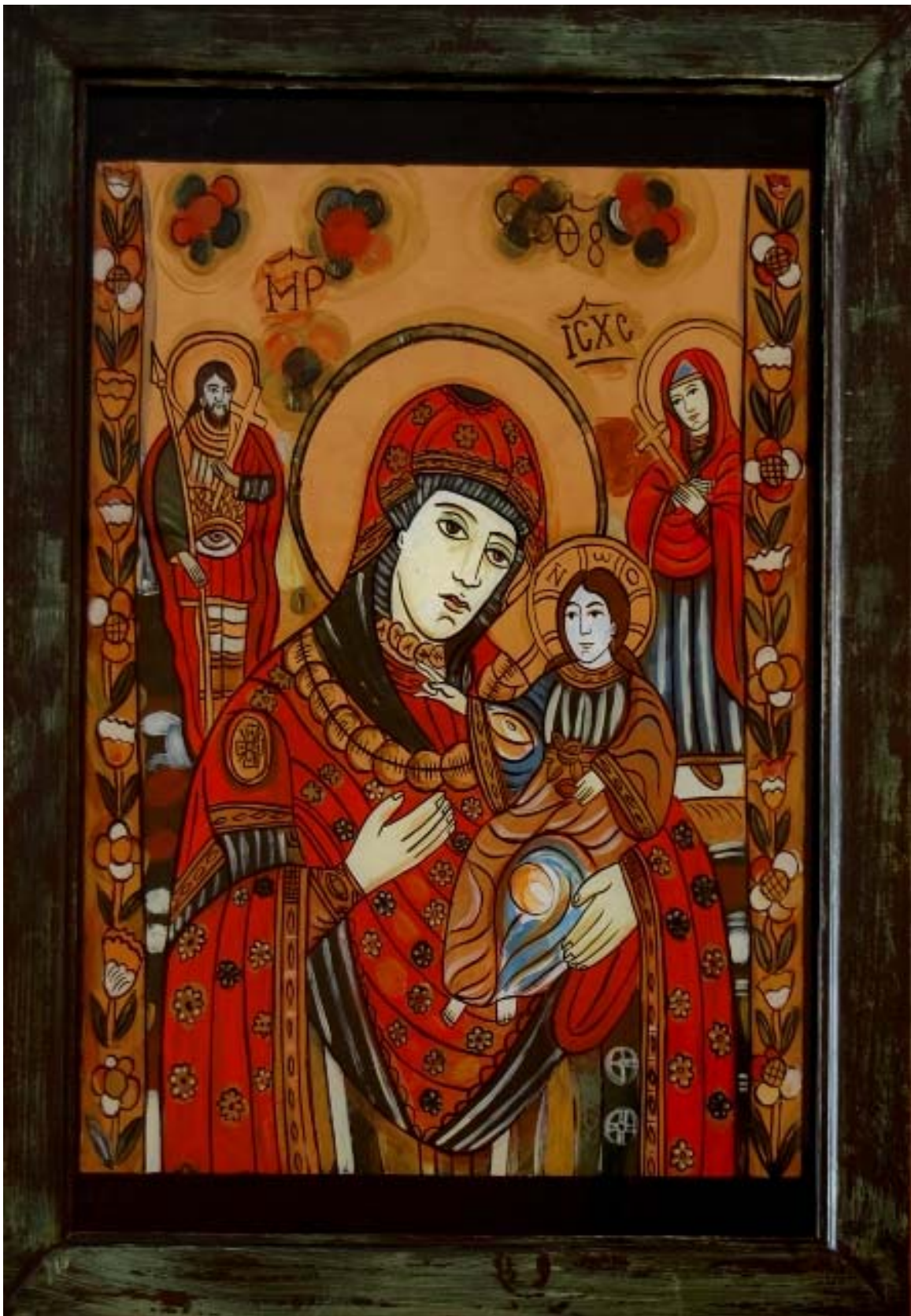
Icoana pe sticla “Maica Domnului cu pruncul”