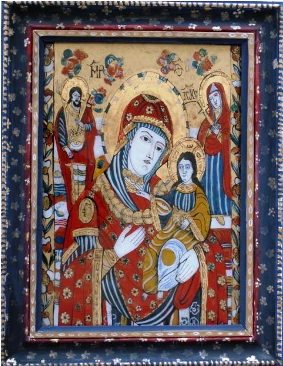
Icoana pe sticla “Maica Domnului cu Pruncul”