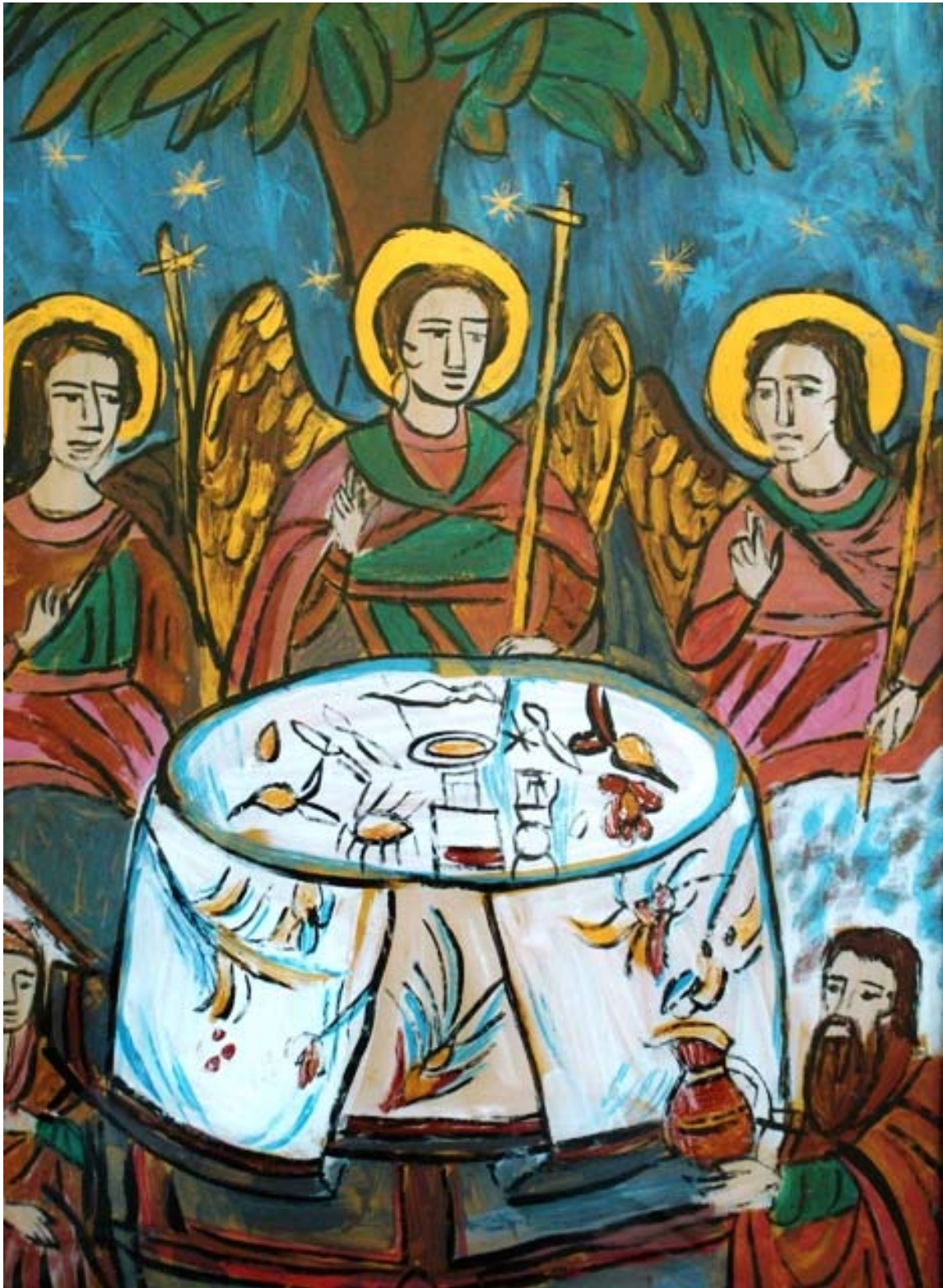
Icoana pe sticla "Sfanta Treime"