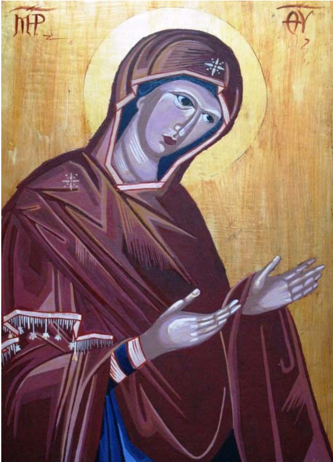
Icoana pe lemn "Maica Domnului"