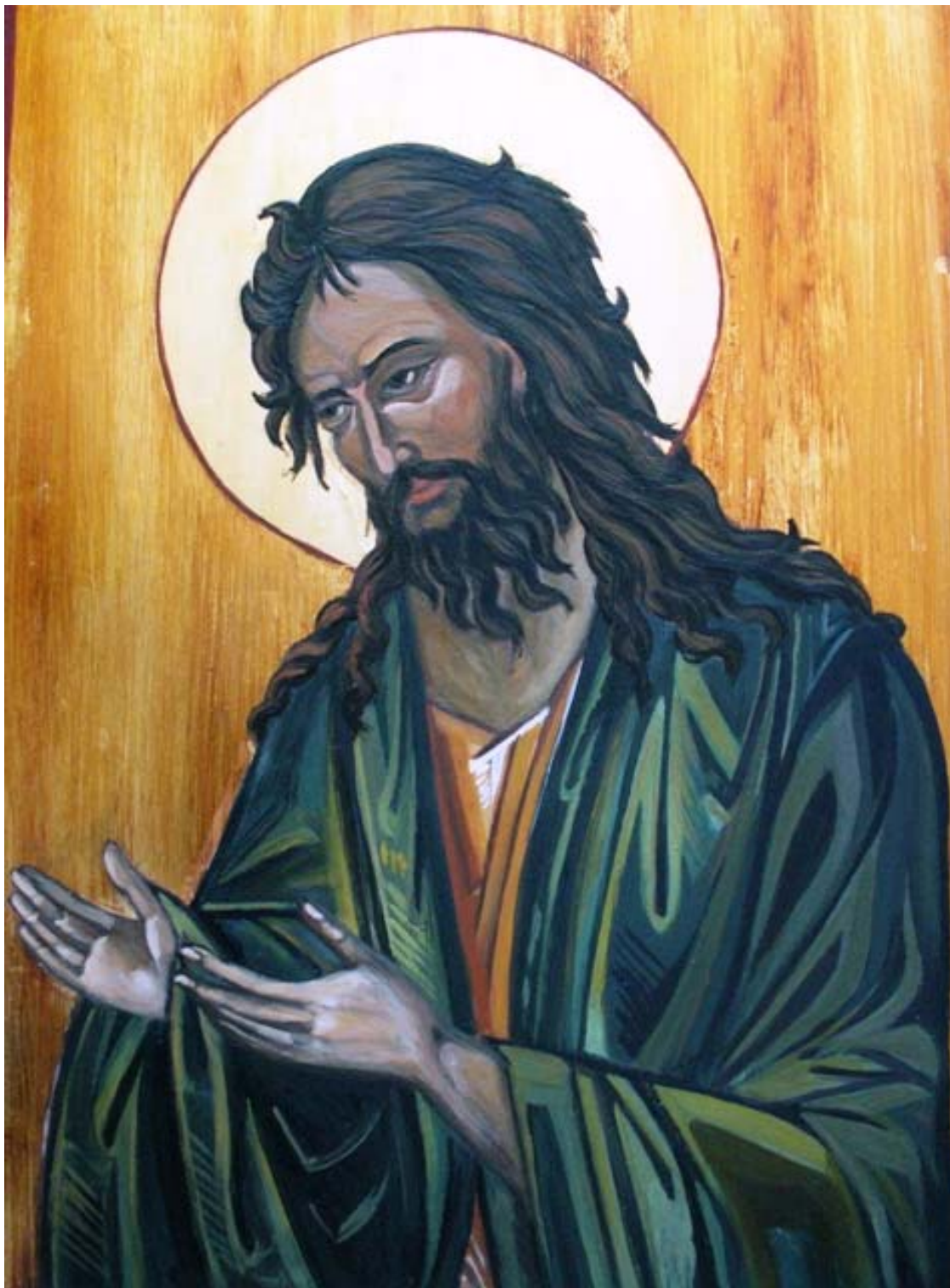
Icoana pe lemn "Sf. Ioan Botezatorul"