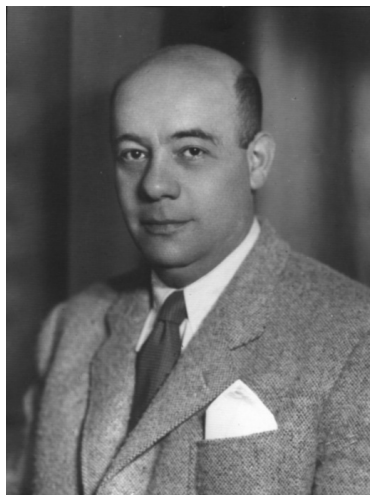
Ambasador la Ankara