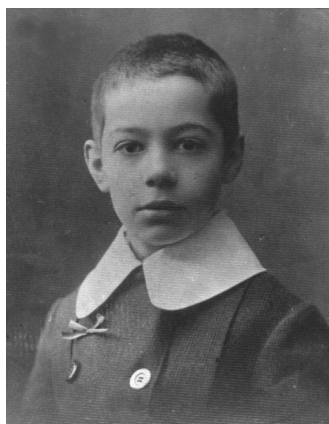
La școală (13 ani)