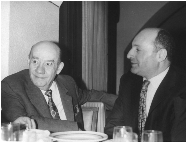
Cu profesorul Solomon Marcus