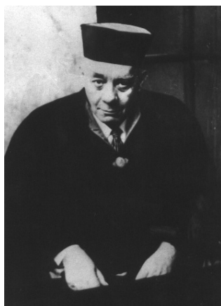
Doctor Honoris Causa al Universității din Bratislava