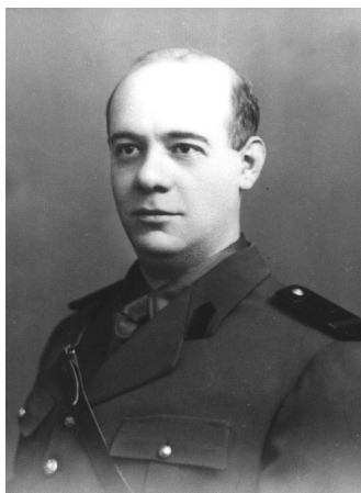
La armată (1940)