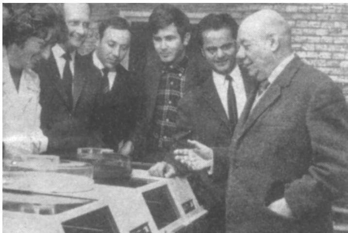
La Centrul de Calcul al Universității din București